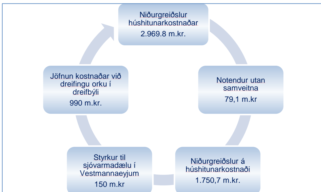
Mynd 2: Samsetning fjárlagaliðar 04-583 árið 2017.

Á fjárlögum 2017 verður sú breyting á að fleiri verkefni koma undir fjárlagaliðinn, niðurgreiðslur á húshitunarkostnaði. Á mynd 2 má sjá hvað fjárlagaliðurinn inniheldur og samkvæmt honum eru 1.750,9 m.kr. til niðurgreiðslna. Dreifbýlisframlagið, til jöfnunar á orkuverði í dreifbýli, til jafns við dýrasta þéttbýlisverð, er innheimt með jöfnunargjalds á alla orku sem fer um dreifikerfið, að undanskyldri stóriðju. Notendur utan samveitna er raforkuframléiðsla í Grímsey og Flatey þar sem ríkissjóður greiðir allan kostnað umfram tekjur af sölu rafmagns á þessum stöðum. Síðan er það einkisgreiðsla til Vestmannaeyja vegna uppsetningar á sjóvarmadælu. Upphaflega voru þetta 300 m.kr. en helmingurinn kom til greiðslu á fjárlögum 2016.