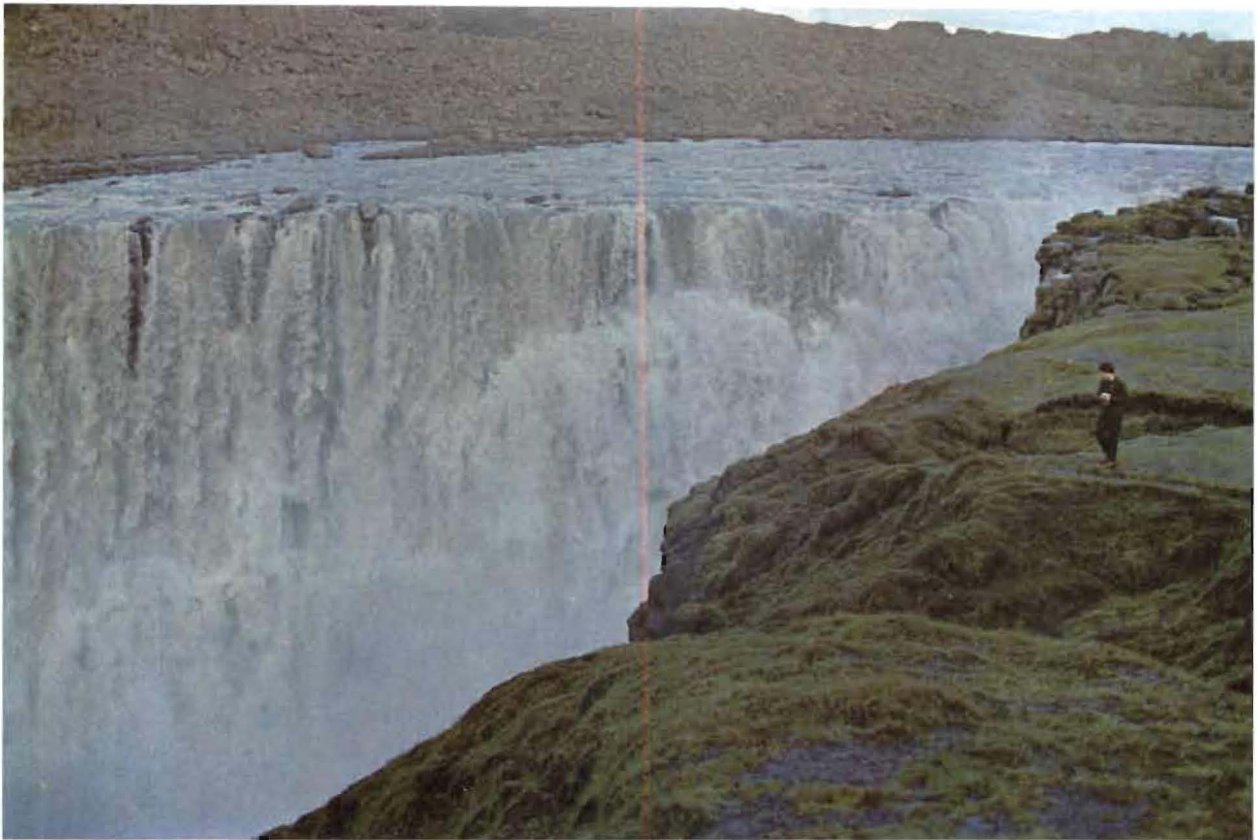
Dettifoss við rennsli 155 kl/sek. Ljós. Birgir Jónsson, 1. júlí 1967