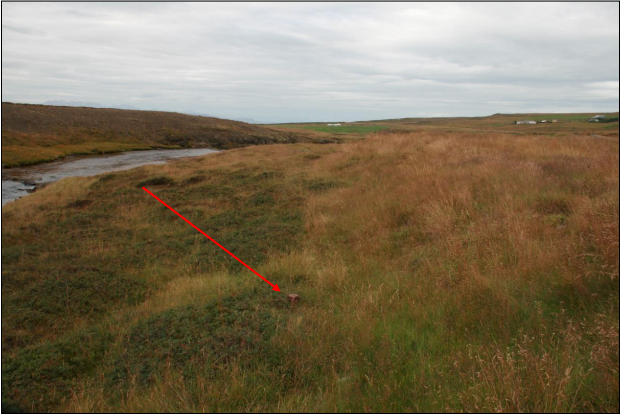
3. mynd. BB-01 á Breiðabólstað. Horft niður með Skorravíkurá. Valþúfa hægra megin á myndinni.

Borhola BB-01 er um 850 metra suðvestur af bænum og er á norðurbakka Skorravíkurár. Holan er í lynghvammi og sést fremur illa. Holan er í góðu ástandi.