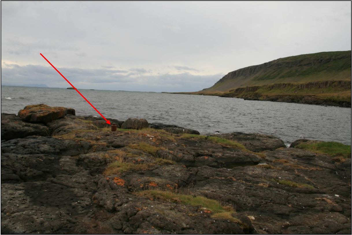
5. mynd. Borhola FF-01 á Staðarfelli. Horft út fjörðinn.

Borhola FF-01 er yst á lengsta klettatanganum niður af félagsheimilinu rétt fyrir innan Staðarfell. Í vikinni fyrir utan eru gömul naust. Holan er í þokkalegu ástandi.