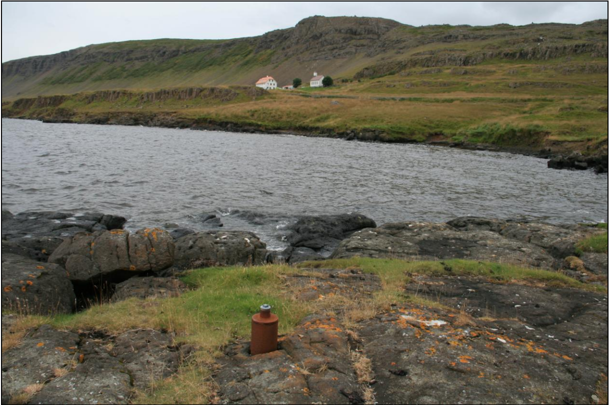
6. mynd. Borhola FF-01 á Staðarfelli. Staðarfell í baksýn.