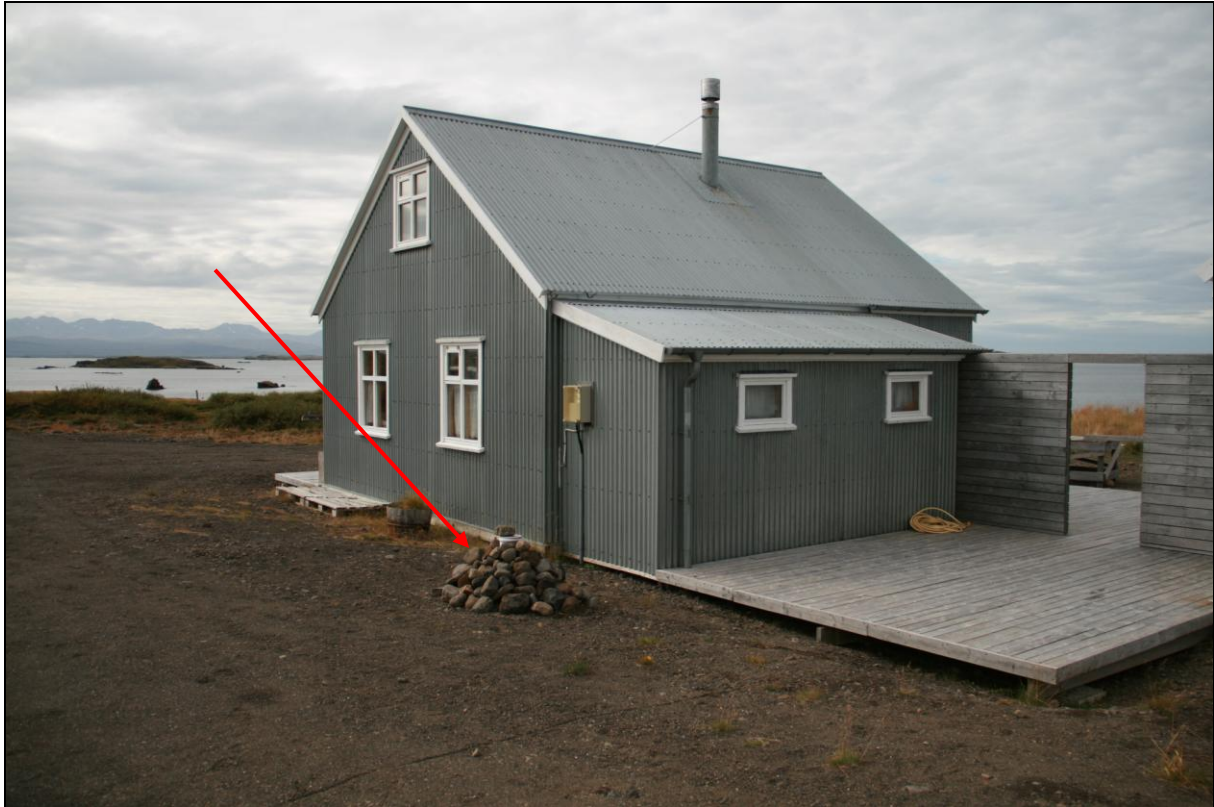
10. mynd. Borhola HF-01 á Kjarlaksstöðum.

Borhola HF-01 er ofan við húsið á Kjarlaksstöðum og í um 2-3 metra fjarlægð frá því. Þetta er gamla íbúðarhúsið sem var á Breiðabólstað en hefur verið flutt og gert upp. Hlaðið hefur verið að holunni. Í henni er dæla og vatnið nýtt.