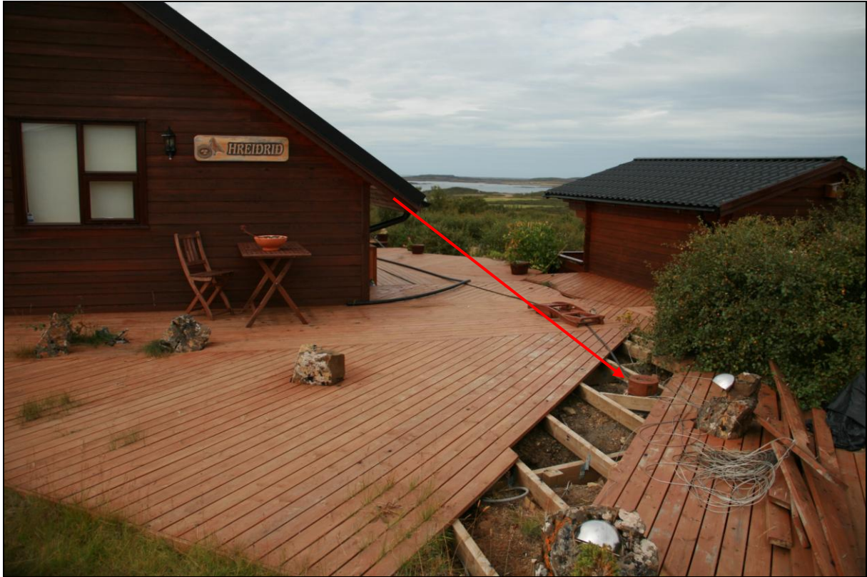
8. mynd. Borhola YF-02 á Ytrafelli.

Borhola YF-02 er við efri sumarbústaðinn (heitir Hreiðrið) vestan veiðislóðans undir Ytrafellsmúla. Holan er undir sólpalli ofan við húsið. Í holunni er dæla og var vatnið nýtt til skamms tíma. Hreinsa þarf holuna til að nýta hana.