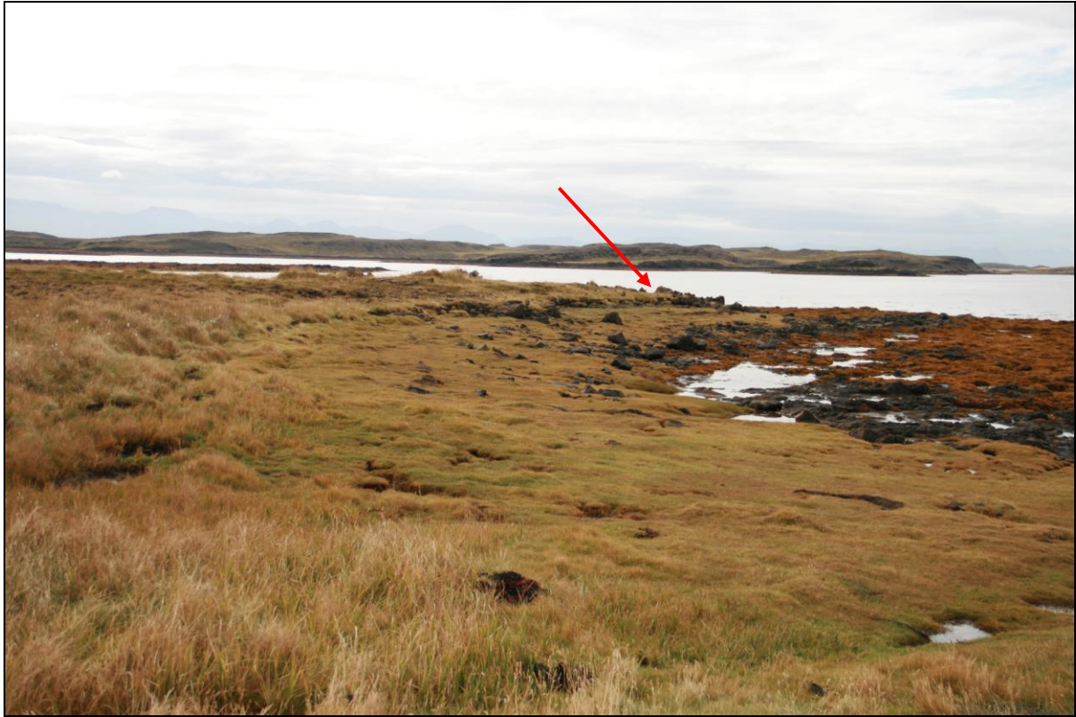
12. mynd. Borhola HN-01 á Hnúki.

Borhola HN-01 var yst í nesinu suðvestur af bryggjunni niður af Hnúki. Holan var þar á klettabrún og virðist vera horfin.