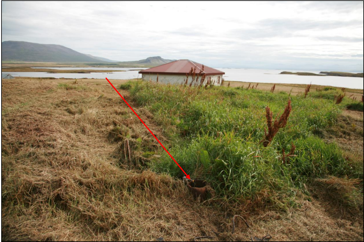
11. mynd. Borhola AF-01 í Arnarbæli.

Borhola AF-01 er um 50 metra vestur af íbúðarhúsinu. Hún er upp á klettholti og í túnjarði. Holan er illa farin. Sett var í hana dæla en vatnið reyndist óneysluhæft vegna seltu.