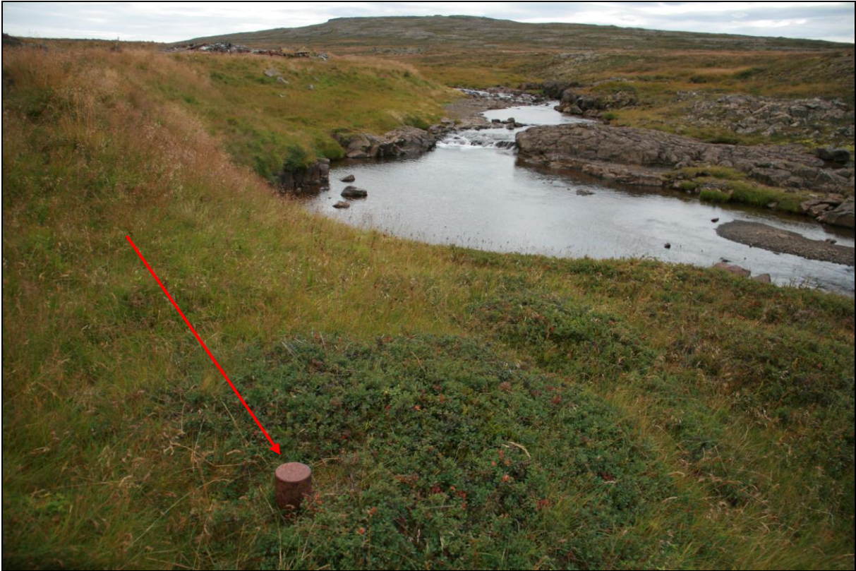
4. mynd. Borhola BB-01 á Breiðabólstað. Horft upp með Skorravíkurá.