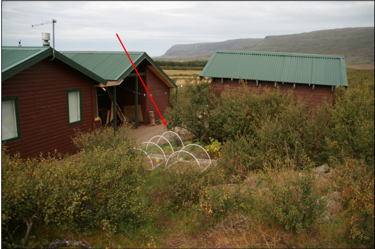
7. mynd. Borhola YF-01 á Ytrafelli. Horft út Fellsströnd.

Borhola YF-01 er við neðsta sumarbústaðinn (og vestan veiðislóðans) vestan undir Ytrafellsmúla. Holan mun vera undir sólpalli ofan við húsið. Í holunni er dæla og vatnið er nýtt.