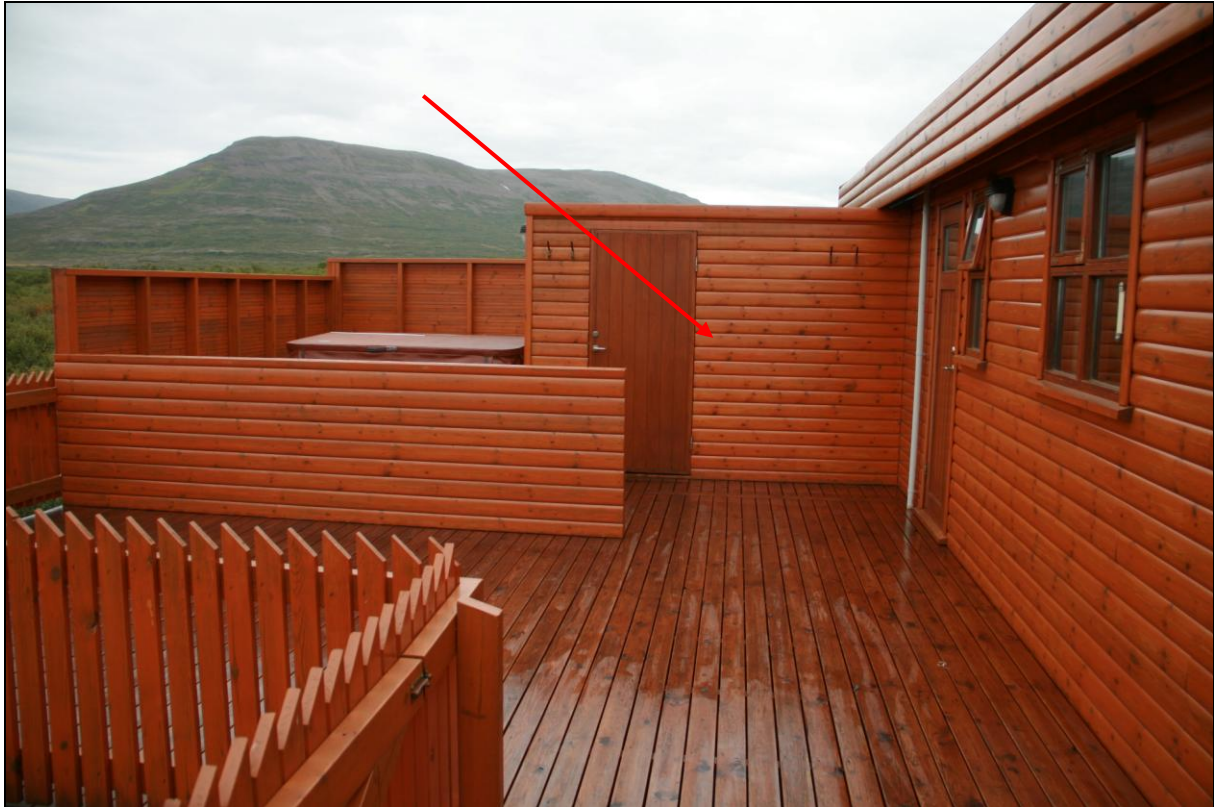
9. mynd. Borhola YF-03 á Ytrafelli.

Borhola YF-03 er við sumarbústaðinn sem er beint undir Ytrafellsmúla og austan veiðislóðans. Holan er inni í skúr sem byggður er við sumarhúsið. Í holunni er dæla og vatnið nýtt.