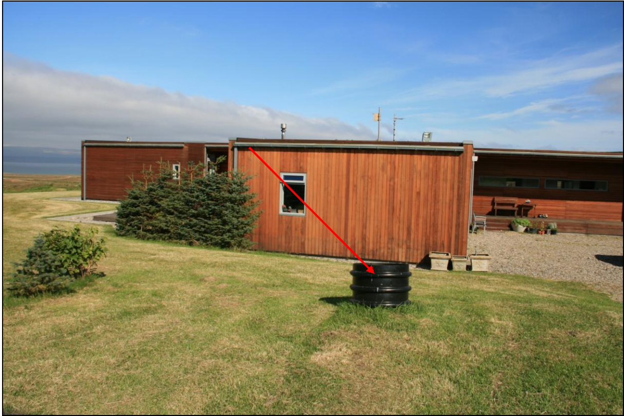
6. mynd. Borhola GA-01 á Gautastöðum. Íbúðarhúsið í baksýn.

Borhola GA-01 er í grasflöt bak við húsið á Gautastöðum. Holan er í plastbrunni og vel frá henni gengið. Dæla er í holunni og vatnið nýtt.