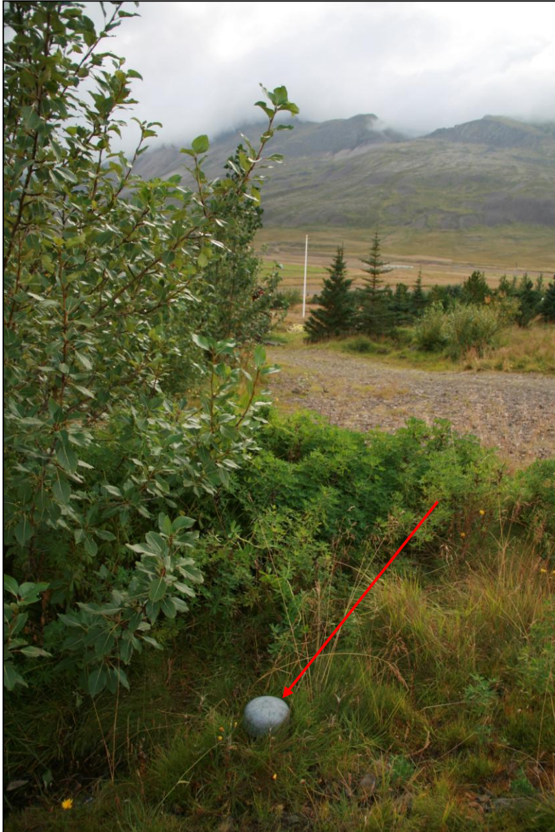
4. mynd. Borhola HL-02 í Hlíð. Sumarhúsið er bak við trén til vinstri á myndinni.

Borhola HL-02 er ofan við sumarbústað sem er neðan Þjóðveggar og gegnt bænum Hlíð. Holan er um 30-40 metra ofan við sumarhúsið og er austan við heimreiðina þar sem hún sveigir niður að bústaðnum. Í holunni er dæla og vatnið nýtt.