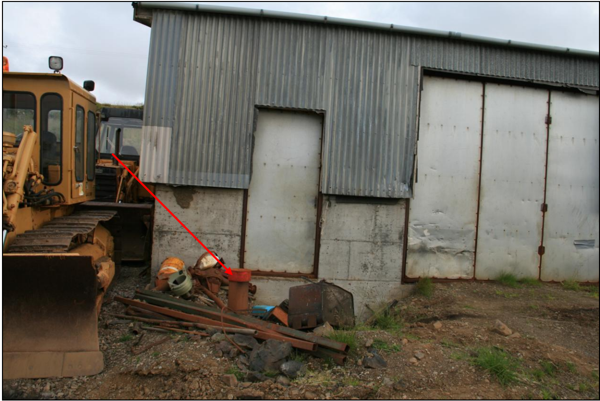
5. mynd. Borhola KS-01 á Ketilsstöðum.

Borhola KS-01 er undir skemmuvegg bak við íbúðarhúsið á Ketilsstöðum. Vatn er í holunni en dæla hefur ekki verið sett í hana.