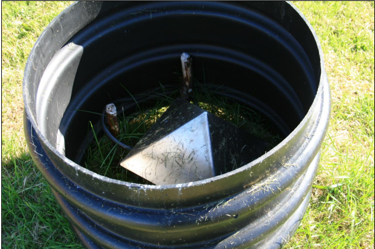
7. mynd. Borhola GA-01 á Gautastöðum.