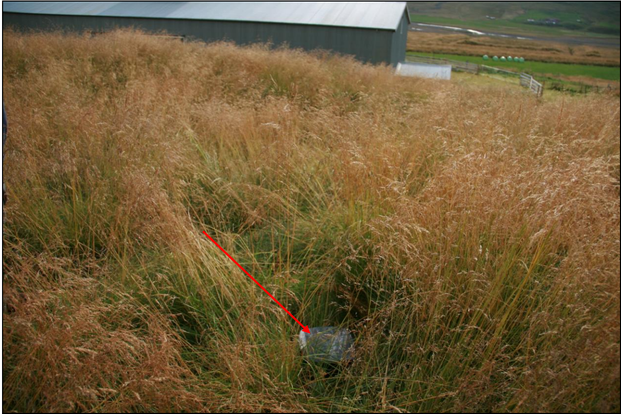
3. mynd. Borhola HL-01 í Hlíð. Fjárhúsin í baksýn.

Borhola HL-01 er um 120 metra norðaustur af bænum og er ofan við nyrðri enda fjárhúsanna. Hún er þar í óslægju og erfitt að finna hana. Í holunni er dæla og vatnið nýtt.