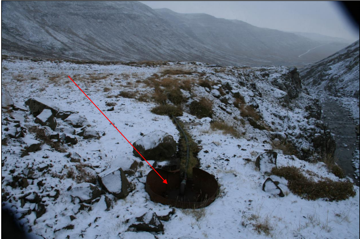
18. mynd. Borhola NB-07.

Borhola NB-07 er innsta holan við Reykjagil og er um 50 metrum innar en hola NB-06. Holan er aðeins um tvo metra frá gilbrúninni. Holan er tengd lögninni niður í Norðurbotn en ástand holunnar er heldur bággt (18. mynd).