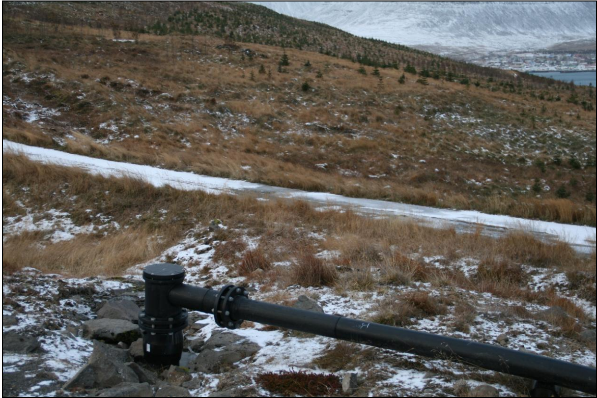
22. mynd. Borhola HD-01.

Borhola HD-01 er um 70 metra utan við Höfaðdalsá og um 10 metra ofan við veginn út að Suðureyri. Holan er tengd og er í góðu ástandi (22. mynd).