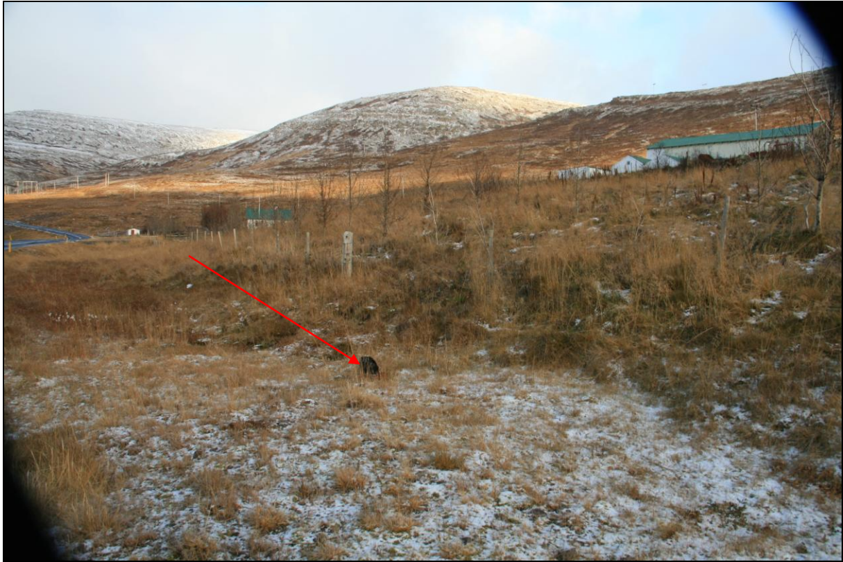
11. mynd. Borhola HT-04. Hjallatún er efst til hægri.

Borhola HT-04 er um 150 m suður af Hjallatúni og nokkra metra ofan við Þjóðveginn. Holan sést illa og er opin og í slæmu ástandi (11. mynd).