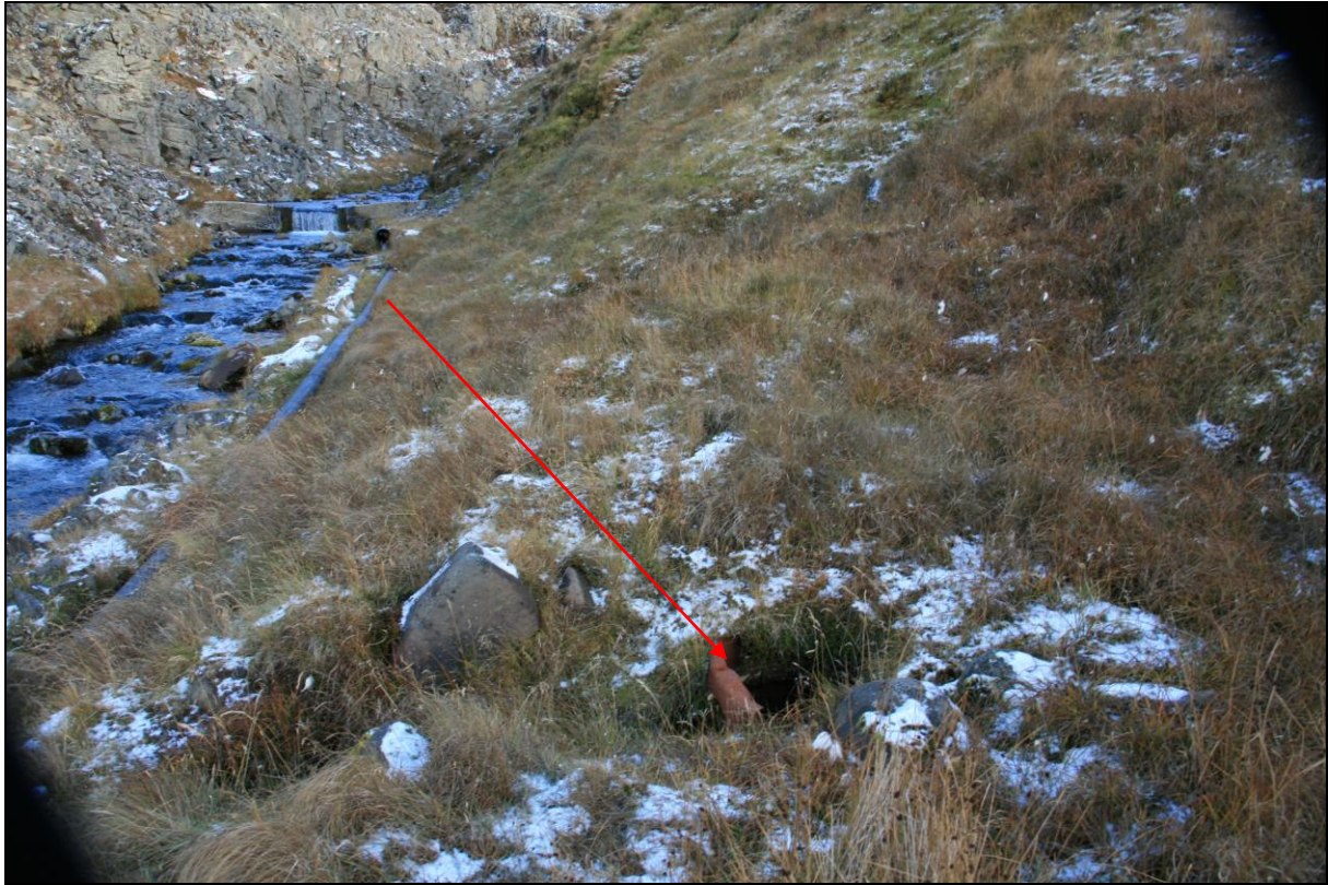
10. mynd. Borhola HT-03.

Um 70 metra norðvestur af holu HT-01 og niður í gilinu við ána sem fellur eftir Keldeyrardal er borhola HT-03. Holan er þar í brekkufætinum. Hún er opin og illa farin (10. mynd).