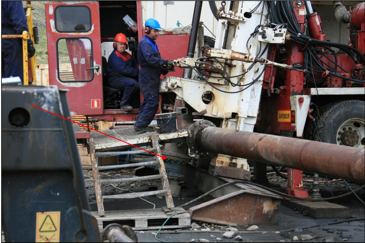
6. mynd. Borhola LL-06 í Litla-Laugardal.

Borhola LL-06 í Litla-Laugardal er neðan við þjóðveginn skammt innan við heita pottinn sem þar er fyrir ofan. Stór borteigur er í kringum holuna og frágangur er góður (6. mynd).