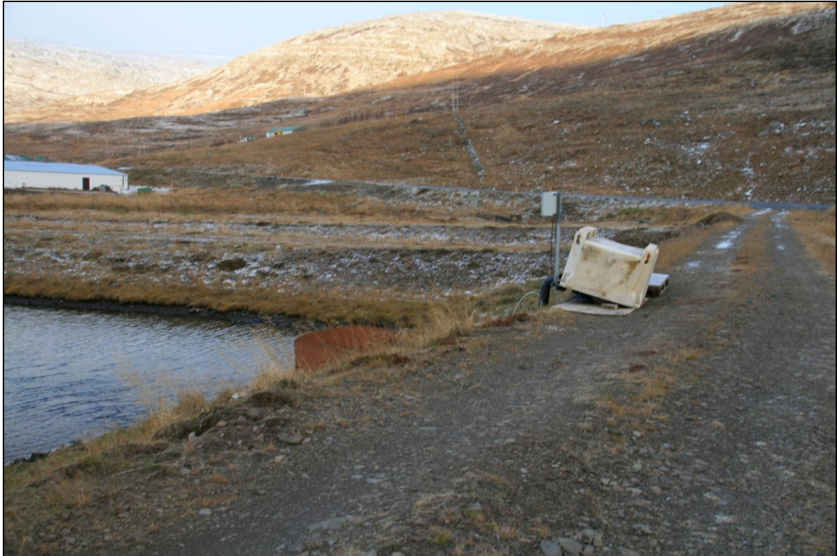
13. mynd. Borhola NB-02 í Norðurbotni. Fiskeldisstöðin er vinstra megin á myndinni.

Borhola NB-02 er um 120 metrum suður af fiskeldisstöðinni í Norðurbotni. Holan er í vegbrún við innri enda eldistjarnar. Í holunni er dæla og vatnið notað í eldishús. Yfir henni er fiskikar úr plasti (13. mynd).