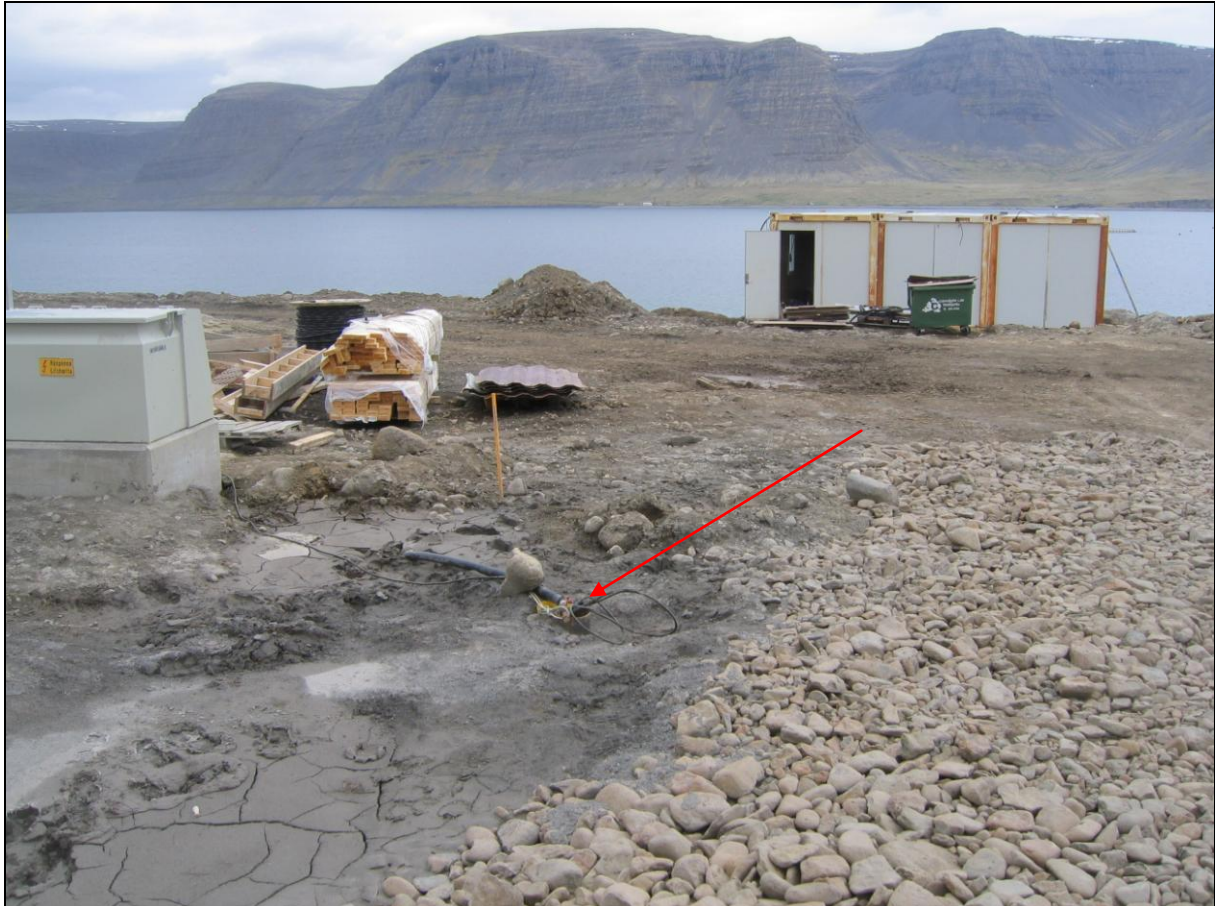
5. mynd. Borhola SL-04 í Stóra-Laugardal.

Borhola SL-04 er um 800 metra utan við Laugardalsá. Hún er neðan við þjóðveginn og ofan við fiskeldisaðstöðina sem þar er. Holan var boruð til að ná köldu vatni en hún er mjög treg. Eins og er þá er hún opin (5. mynd).