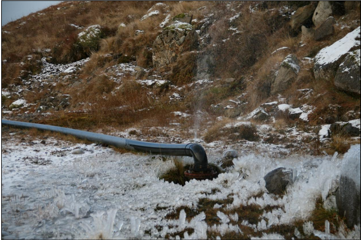
14. mynd. Borhola NB-03 í Norðurbotni.

Borhola NB-03 er um 500 metra suðaustur af fiskeldisstöðinni. Hún er þar í hlíðarfætinum og er plan í kringum hana. Holan er tengd og í þokkalegu ástandi. Vatnið er notað í fiskeldið í Norðurbotni (14. mynd).