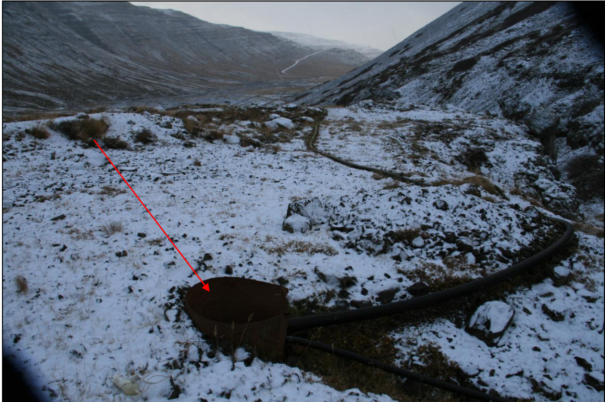
17. mynd. Borhola NB-06

Borhola NB-06 er um 60 metra innan við NB-04. Hún er aðeins nokkra metra frá gilþröminni. Holan er tengd lögninni niður í Norðurbotn. Ástand holunnar er heldur bágborið (17. mynd).