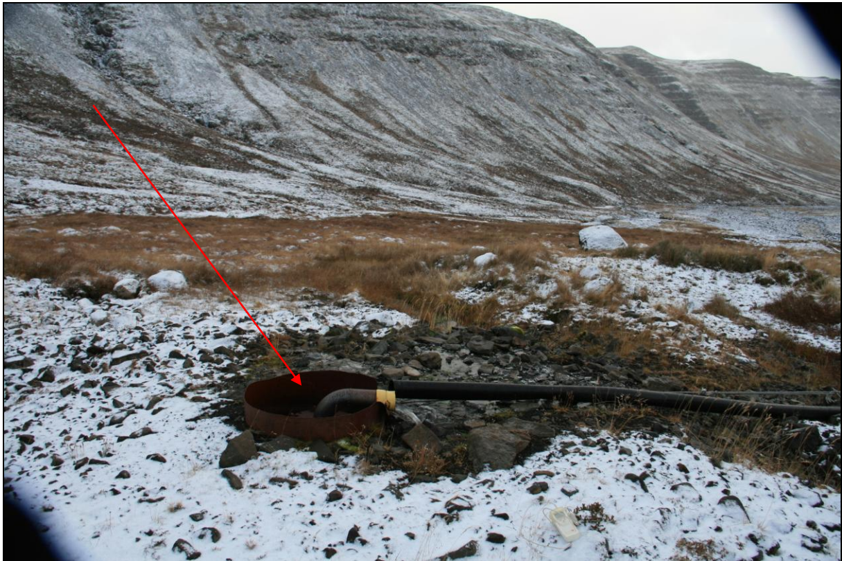
15. mynd. Borhola NB-04 við Reykjagil.

Borhola NB-04 er á suðurbakka Reykjagils. Þar eru fimm holur á um 160 metra kafla. Hóla NB-04 er í miðið af þeim. Hún er skammt frá gilþröminni. Holan hefur um tíma verið tengd lögn sem lá að fiskeldisstöðinni í Norðurbotni en er nú ótengd. Nú er hún með hnúi og vatn streymir gegnum það. Ástand holunnar er bággt (15. mynd).