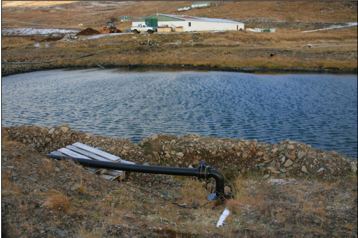
12. mynd. Borhola NB-01. Fiskeldisstöðin í Norðurbotni í baksýn.

Borhola NB-01 er um 80 metra suðvestur af fiskeldisstöðinni í Norðurbotni. Holan er á garði milli tveggja eldistjarna. Hún er tengd og vatnið notað í eldishúsi. Ástand hennar er gott (12. mynd).