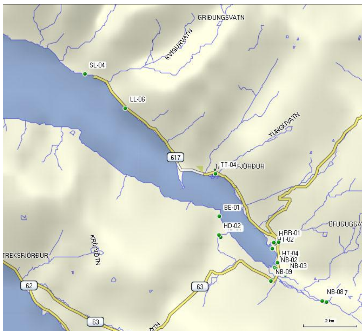
1. mynd. Staðsetning borholna í Tálknafirði.