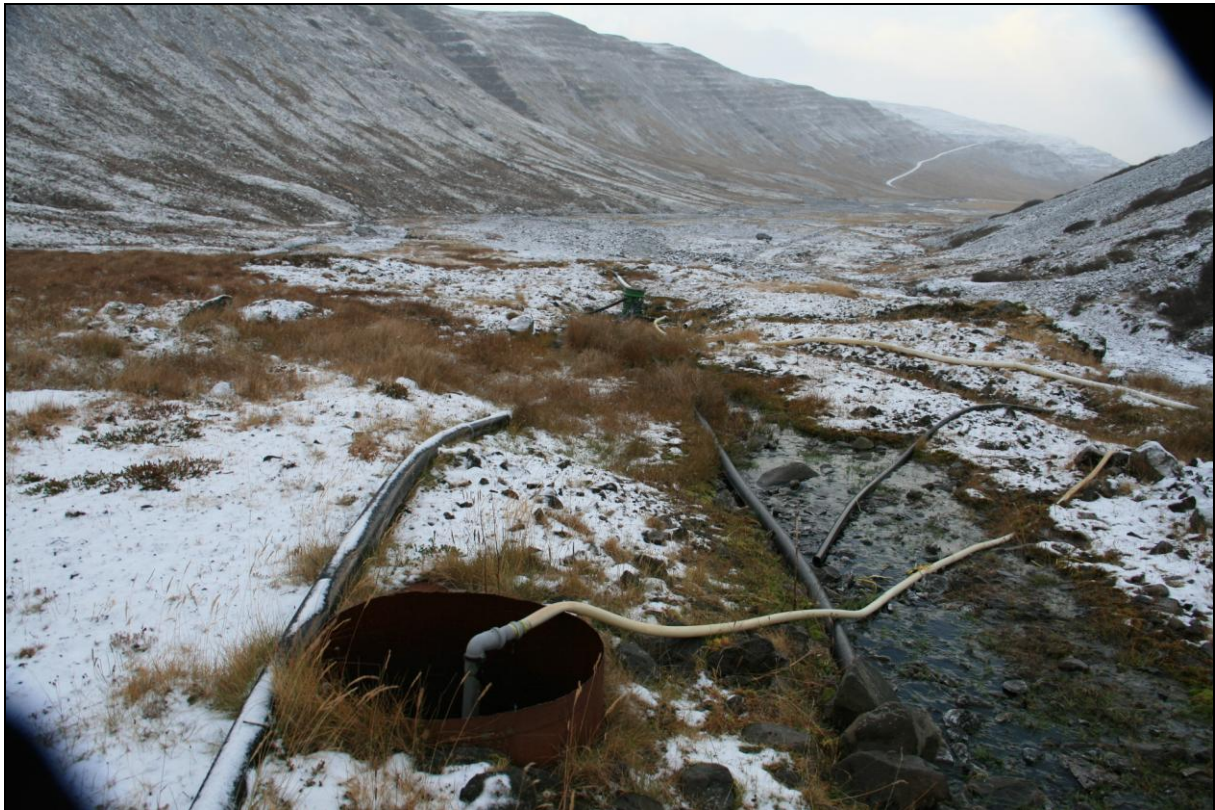
16. mynd. Borhola NB-05.

Borhola NB-05 er 50 metrum utar en hola NB-04. Frágangur er svipaður og í holu NB-04 en hún er lokuð og grennra rör er upp af henni og úr því slanga sem vatn streymir eftir. Ekki er að sjá að holan hafi nokkurn tíma verið tengd. Ástand holunnar er heldur bágborið (16. mynd).