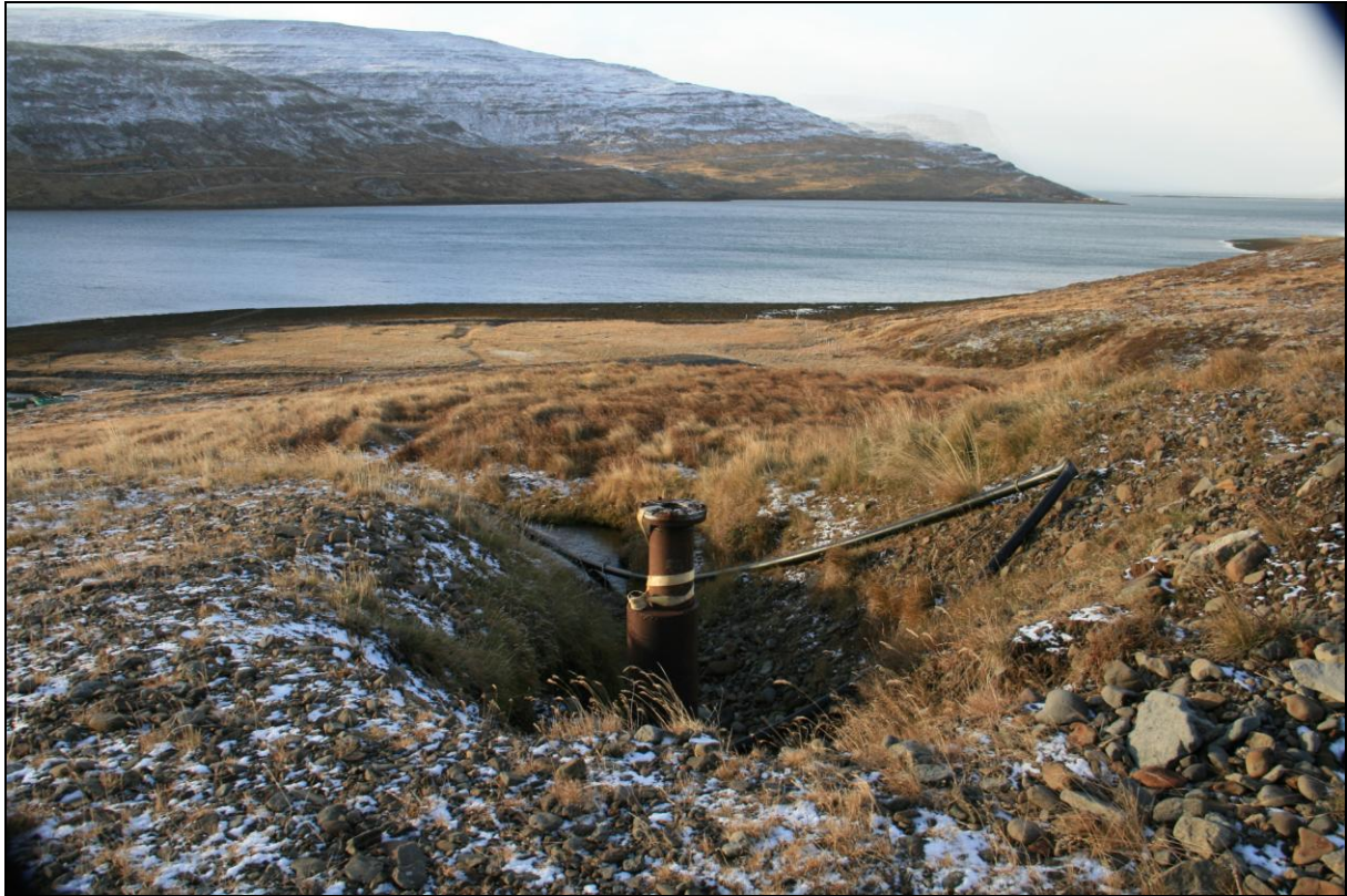
8. mynd. Borhola HT-01.

Eftir Keldeyrardal fellur á og innan við hana er bungumyndaður rani neðan þjóðvegarins. Um 150 metra neðan við spennustöð Orkubúsins og á miðri bungunni er borhola HT-01. Hún er í miðri gryfju sem þar er. Holan er opin en í þokkalegu ástandi (8. mynd).