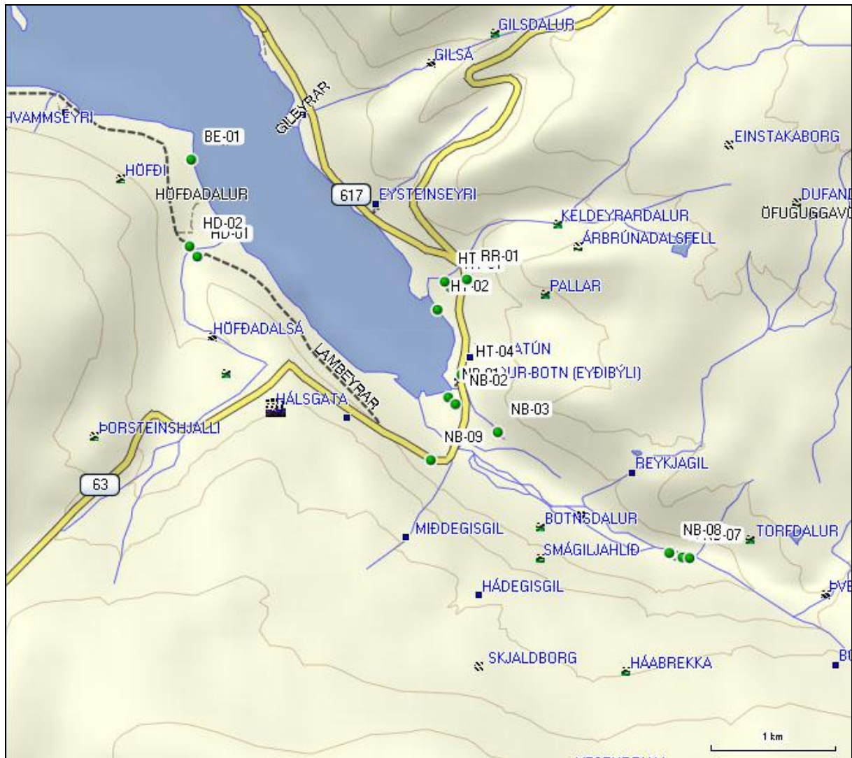
2. mynd. Staðsetning borholna innst í Tálknafirði.