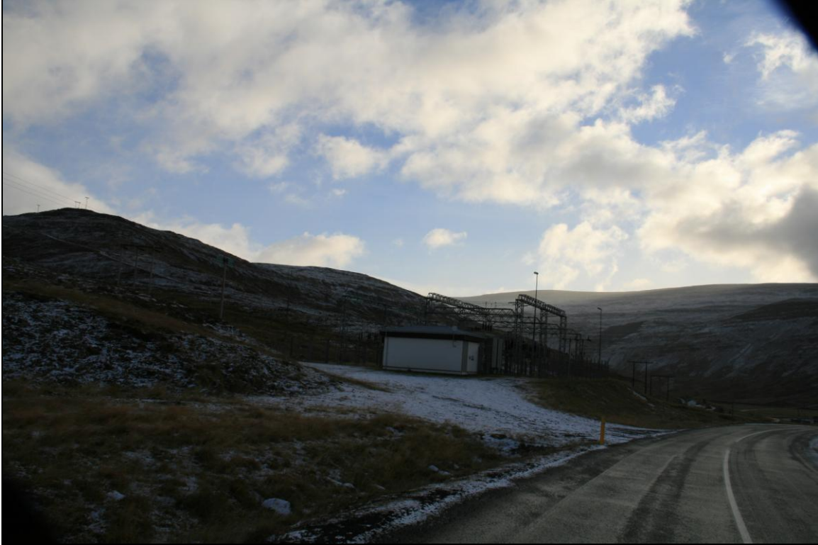
21. mynd. Borhola RR-01 er nærri spennistöðinni.

Borhola RR-01 er skauthola sem boruð var nærri spennistöð Orkubús Vestfjarðar skammt norður af Hjallatúni (21. mynd).