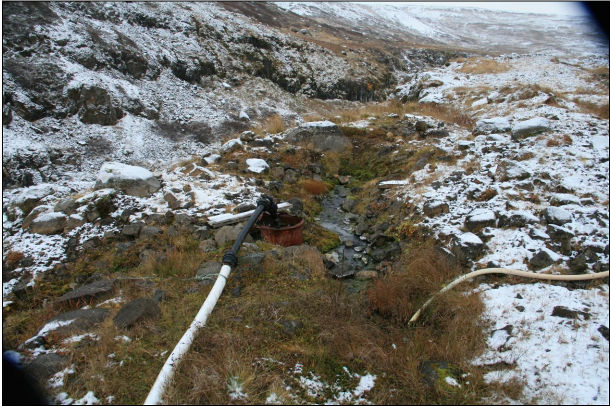
19. mynd. Borhola NB-08.

Borhola NB-08 er ysta holan við Reykjagil. Hún er um 4-5 metra frá gilbrúninni. Holan er tengd en ástand hennar er annars heldur slakt (19. mynd).