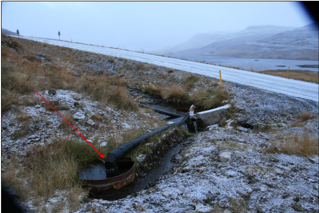
20. mynd. Borhola NB-09.

Borhola NB-09 er ofan við beygjuna á þjóðveginum þar sem hann fer upp frá Norðurbotni og í áttina að Mikladal. Holan er um 10 metra ofan vegar. Hún er tengd og vatnið leitt í fiskeldið í Norðurbotni. Holan var boruð til að afla kalds vatns. Holan er í sæmilegu ástandi (20. mynd).