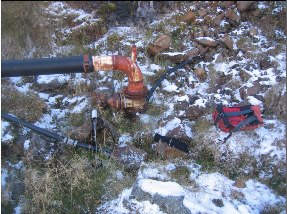
25. mynd. Borhola BE-01.