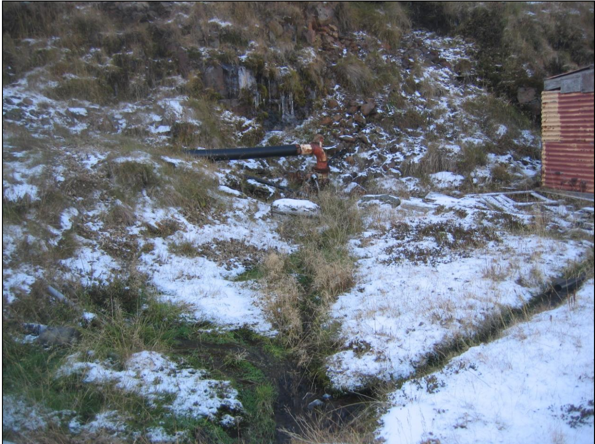
24. mynd. Borhola BE-01

Borhola BE-01 er skammt innan við Búðeyri. Þar er fiskeldisstöð sem ekki er í rekstri. Holan er undir klettapili bak við stöðina. Holan hefur verið tengd á sínum tíma. Ástand hennar er þolanlegt (24. og 25. mynd).