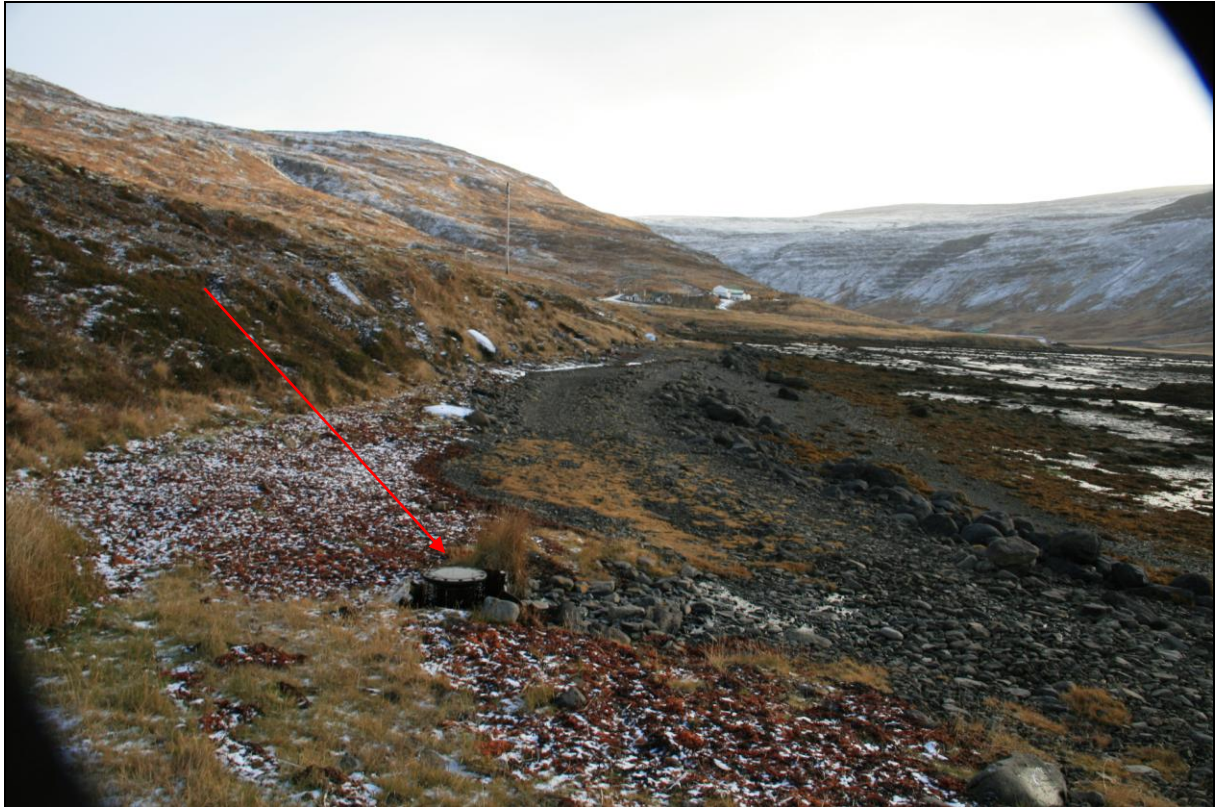
9. mynd. Borhola HT-02.

Borhola HT-02 er um 140 metra innan við ársinn þar sem áin af Keldeyrardal fellur til sjávar. Holan er efst í fjörunni og rétt innan við fiskeldistjarnir sem eru þar. Holan er opin en annars í þokkalegu ástandi (9. mynd).