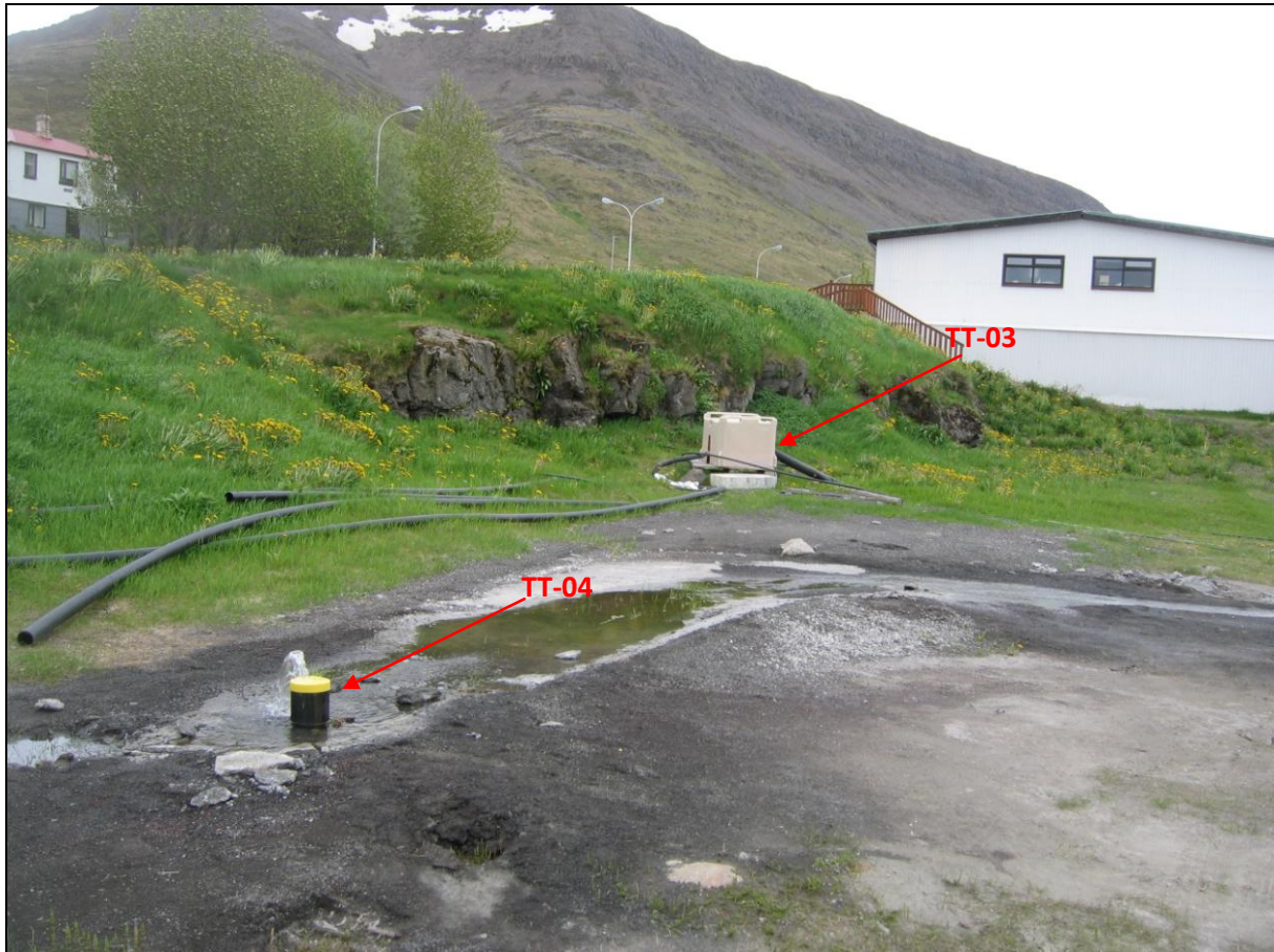
7. mynd. Borhola TT-04 í Tungu.

Borhola TT-04 er um 10-15 metrum utan við borholu TT-03 og skammt utan við frystihúsið og neðan við veginn gegnum þorpið. Holan er með plastloki en volgt vatn streymir undan því. Að öðru leyti er ástand hennar gott (7. mynd).