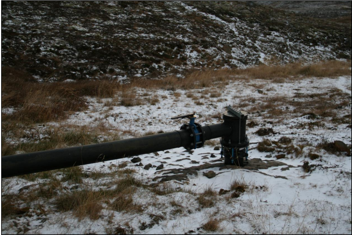
23. mynd. Borhola HDB-02.

Borhola HD-02 er um 50 metra utan við Höfadalsá og rétt ofan við veginn út að Suðureyri. Holan er tengd og er í góðu ástandi (23. mynd).