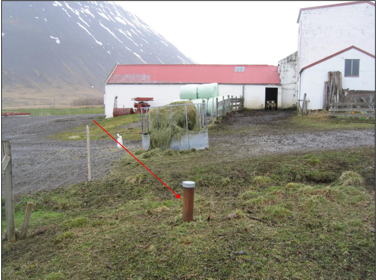
4. mynd. Borhola VA-01 á Vöðlum.

Borhola VA-1 er skammt utan við útihúsin á bænum Vöðlum. Holan er í túnjaðri og með hatt og í ágætu ástandi. Alvarr ehf. boraði (4. mynd).