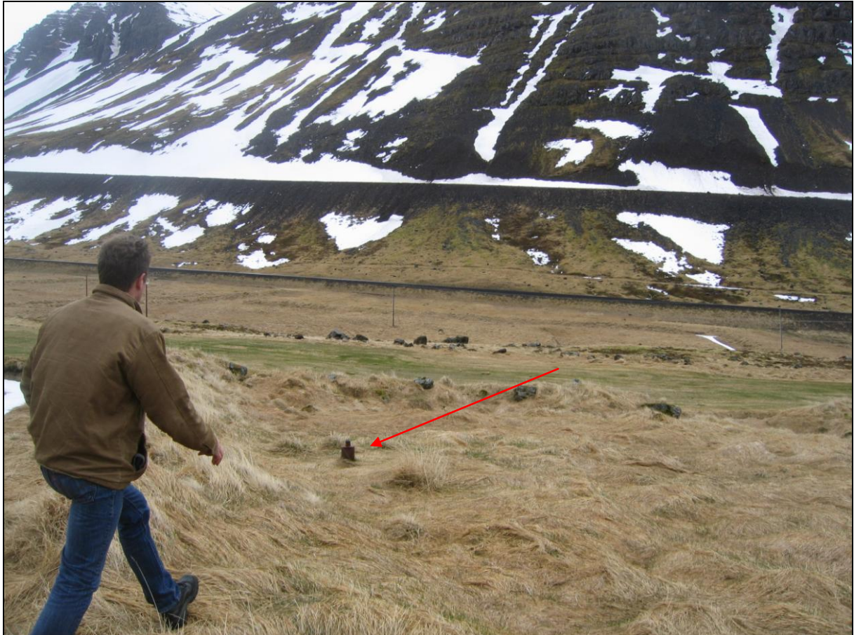
7. mynd. Borhola BRA-01 í Fremri-Breiðadal.

Borhola BRA-01 er um 240 metra austur af holu BRA-05 og framan við bæinn. Hún er í óslægju milli túna sem er mörkuð af skurðum á þrjá vegu. Holan er með loki og í góðu ástandi en sést illa (7. mynd).