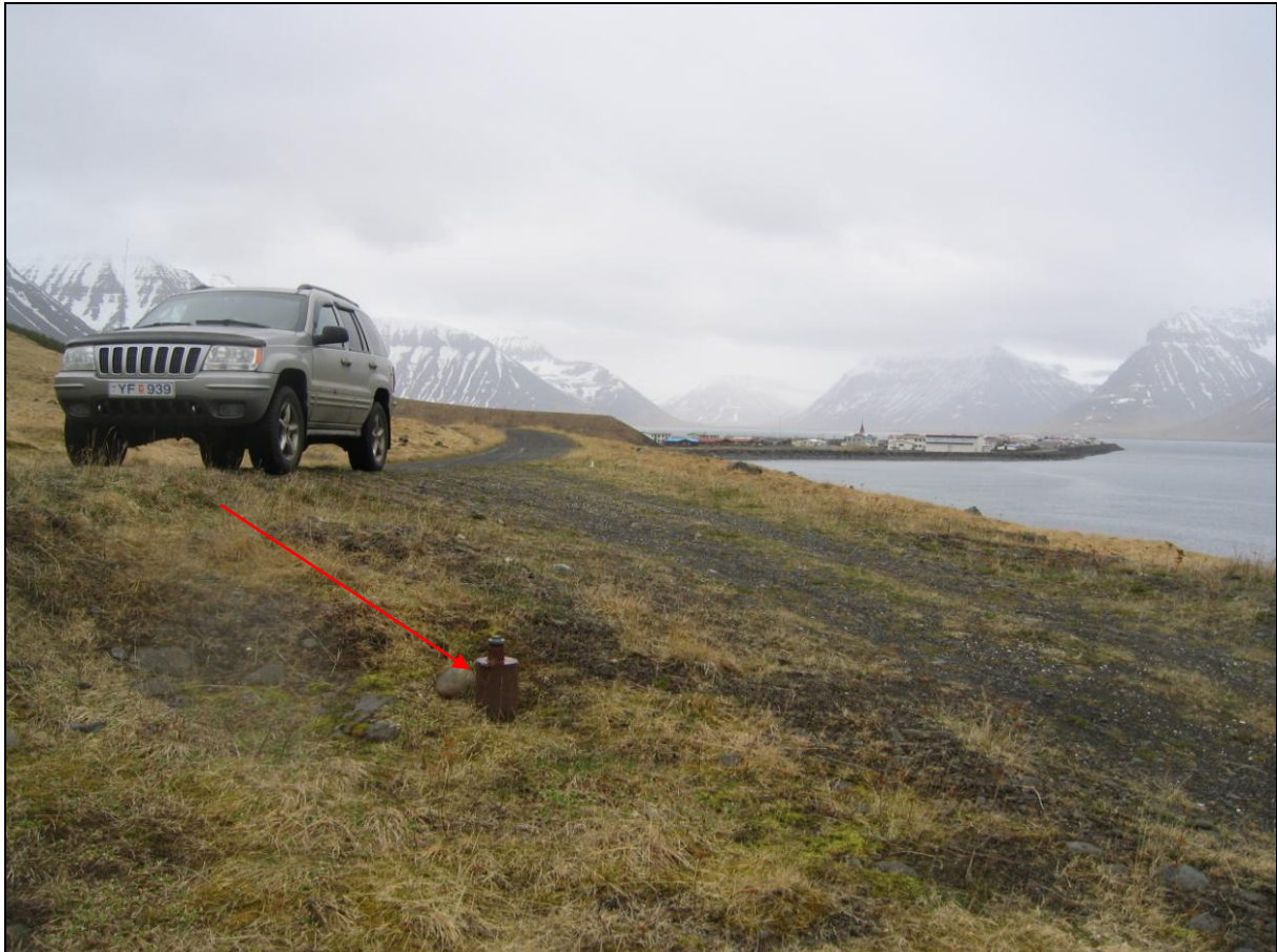
13. mynd. Borhola FE-17 á Eyri.

Borhola FE-17 er um 450 metra utan við Flateyri. Þar er vegar slóði og frá honum annar slóði niður undir fjöruna. Þar sem slóðarnir mætast er hola FE-17. Hún er með loki og í góðu ástandi (13. mynd).