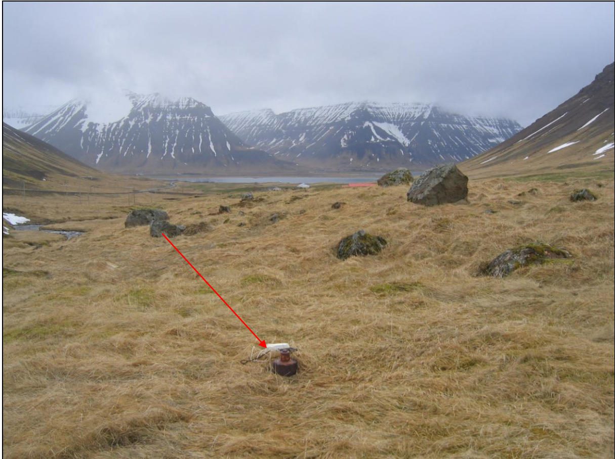
10. mynd. Borhola BRA-03 í Fremri-Breiðadal.

Borhola BRA-03 er um 240 metrum austan við borholu BRA-02 og er á norðurbakka Langár. Hún er í uppgróinni urð. Holan er með loki og er í góðu ástandi en sést illa (10. mynd).