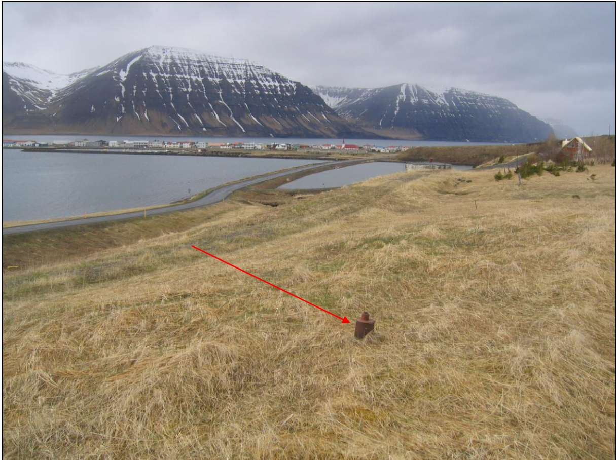
12. mynd. Borhola FE-16 á Eyri.

Borhola FE-16 er um 350 metra innan við Sólbakka. Hún er skammt ofan við gamla þjóðveginn sem liggur uppi á bökkunum. Holan er með loki og er í góðu ástandi (12. mynd).