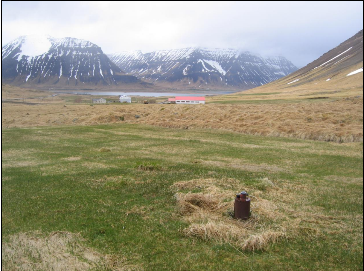
8. mynd. Borhola BRA-04 í Fremri-Breiðadal.

Borhola BRA-04 er um 50 metrum austan við borholu BRA-01 og er í ræktuðu túni. Holan er með loki og í góðu ástandi (8. mynd).