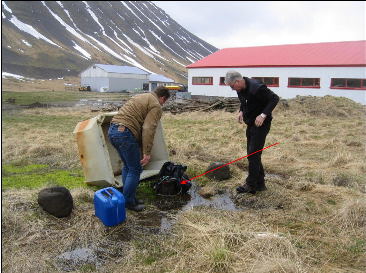
6. mynd. Borhola BRA-05 í Fremri-Breiðadal.

Borhola BRA-05 er 15-20 metra innan við stóra skemmu sem er innst og efst húsa í Fremri-Breiðadal. Holan er undir stóru fiskikari og í henni er dæla. Vatnið er notað til neyslu í Fremri Breiðadal (6. mynd).