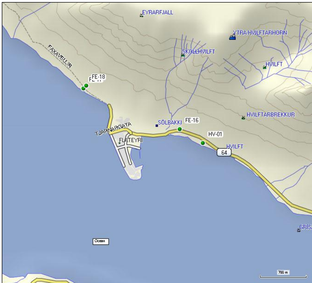
3. mynd. Staðsetning borholna í landi Eyrar.