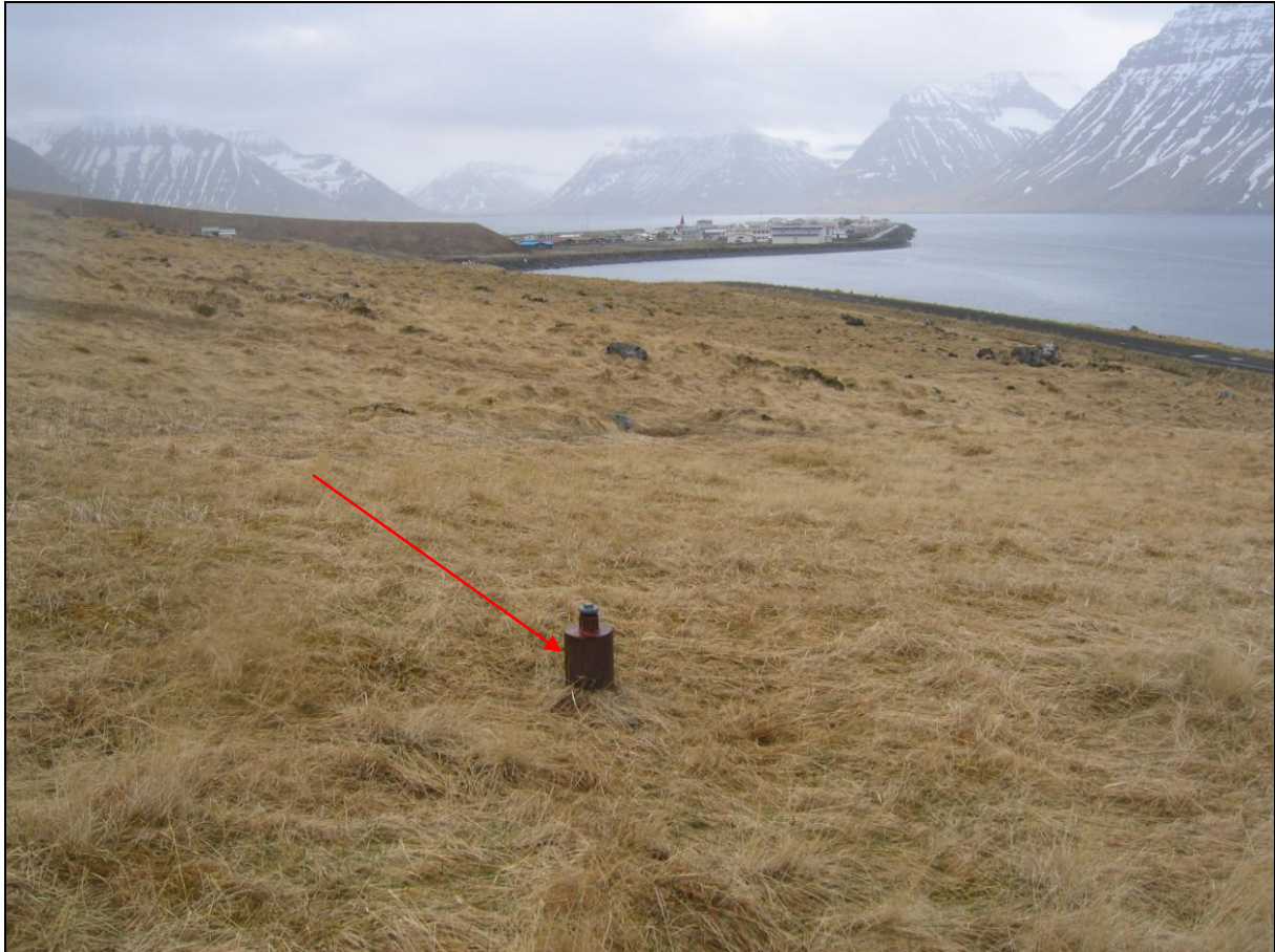
14. mynd. Borhola FE-18 á Eyri.

Borhola FE-18 er um 450 metra utan við Flateyri. Holan er um 50 metra beint upp af holu FE-17. Hún er með loki og í góðu ástandi (14. mynd).