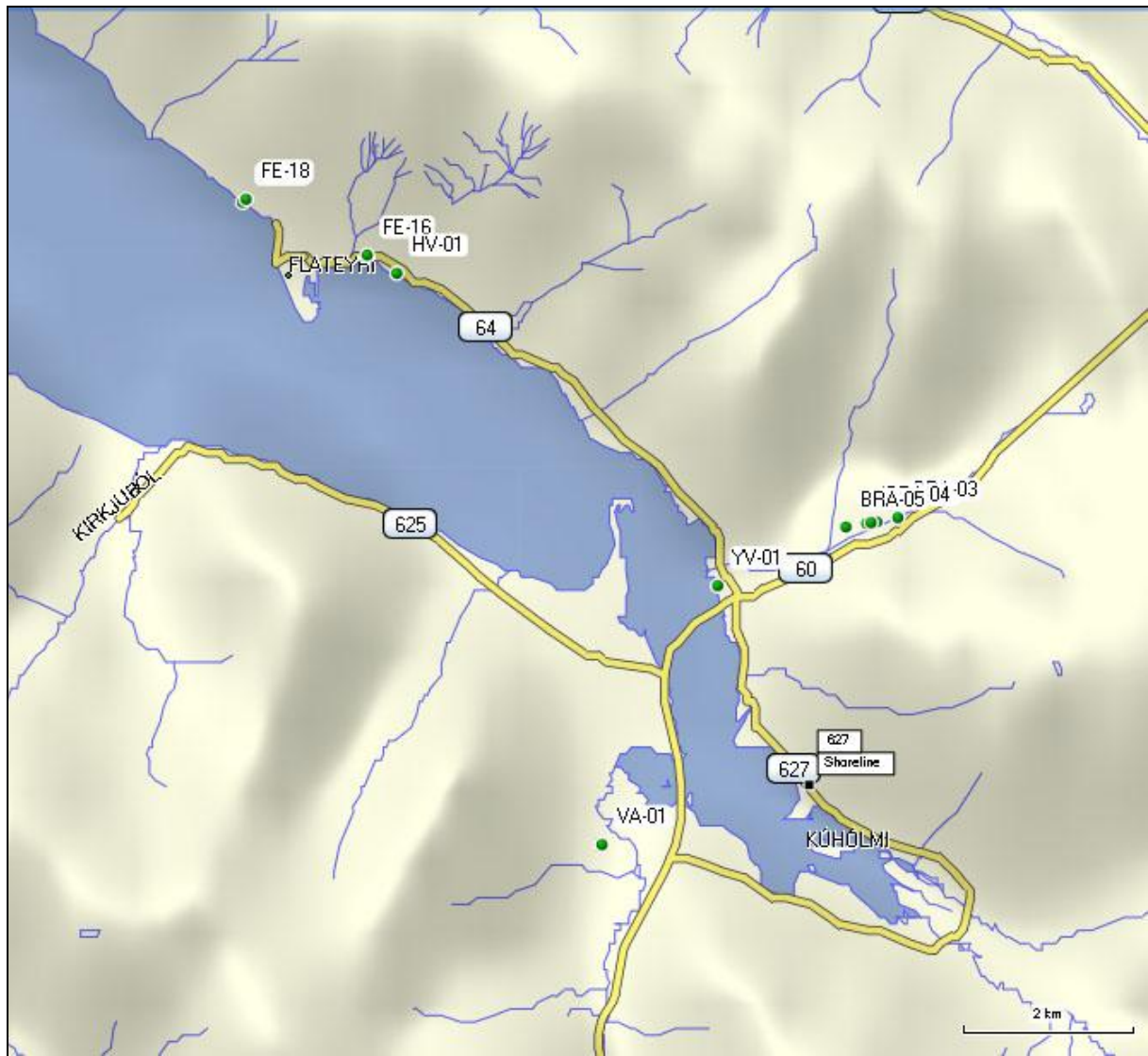
1. mynd. Staðsetningar borholna í Mosvallahreppi og Flateyrarhreppi.