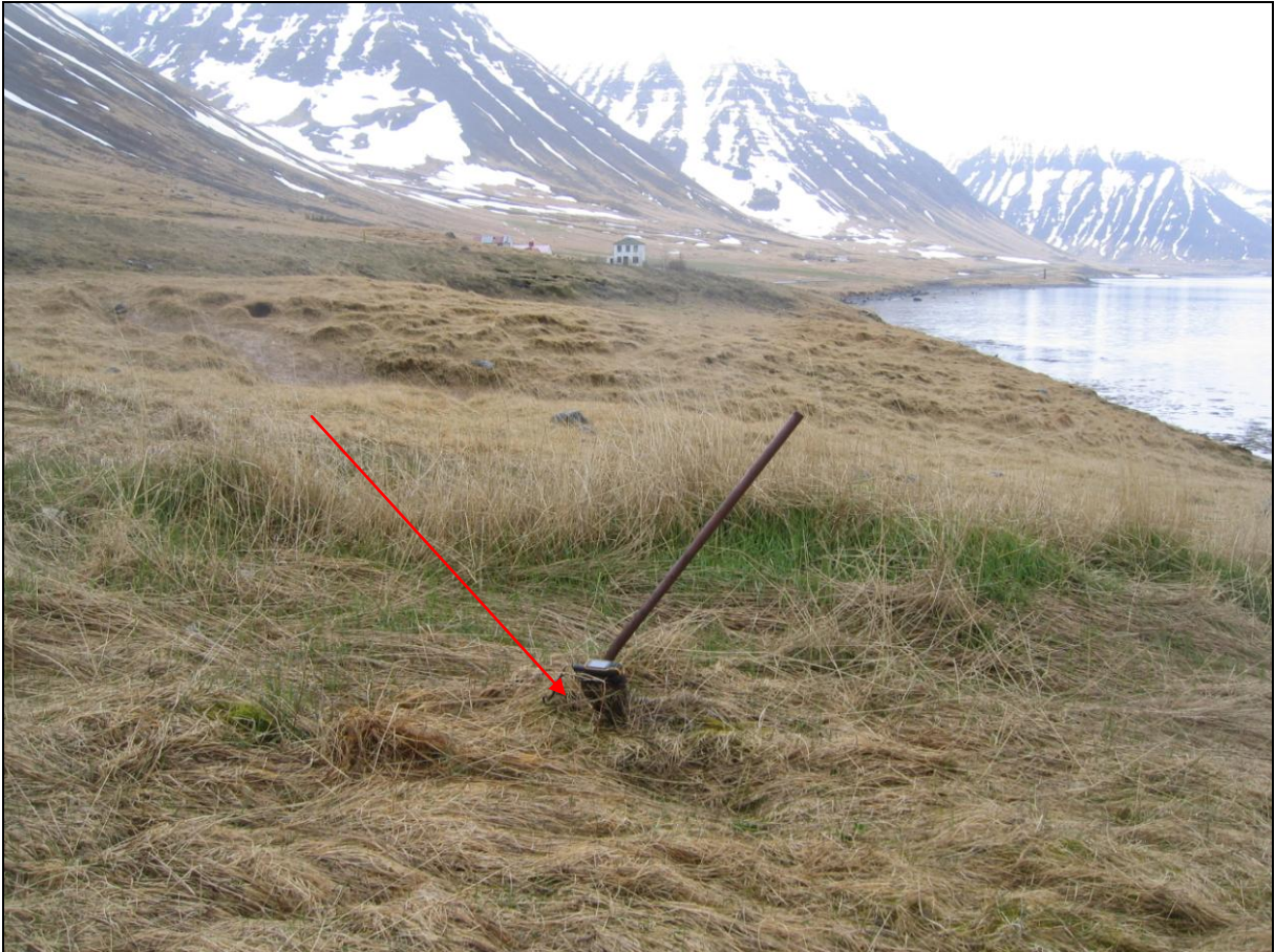
11. mynd. Borhola HV-01 á Hvilft. Hvilftarbærinn í baksýn.

Borhola HV-01 erum um 350 metra utan við bæinn Hvilft og er þar á grónum bakka um 40 metrum neðan við þjóðveginn. Á holunni er lok og grennra rör upp sem nú er bogið og er holan farin að láta á sjá (11. mynd).