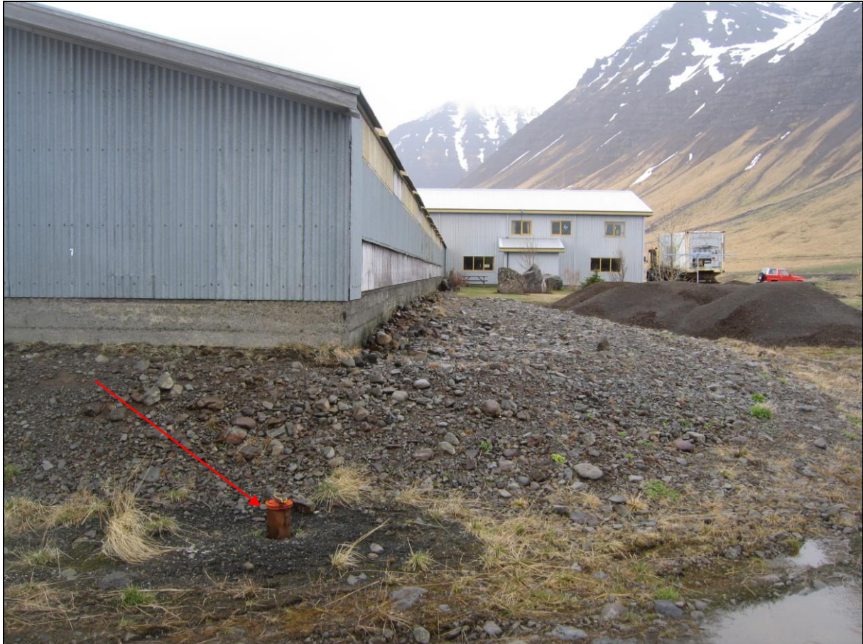
5. mynd. Borhola YV-01 á Ytri-Veðrará.

Óskráð hola sem boruð var af Alvarr ehf. sama árið og borað var á Vöðlum. Hún er við suðaustur hornið á stórrri skemmu. Holan er boruð innan markar sérstakrar lóðar í landi Ytri-Veðrará. Holan er með hatti og í mjög góðu ástandi (5. mynd).