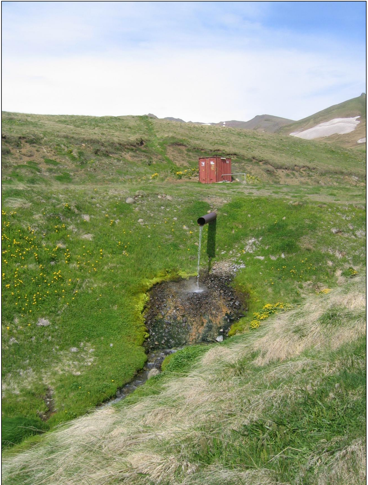
4. mynd. Yfirfall frá holunni niður í lækinn.