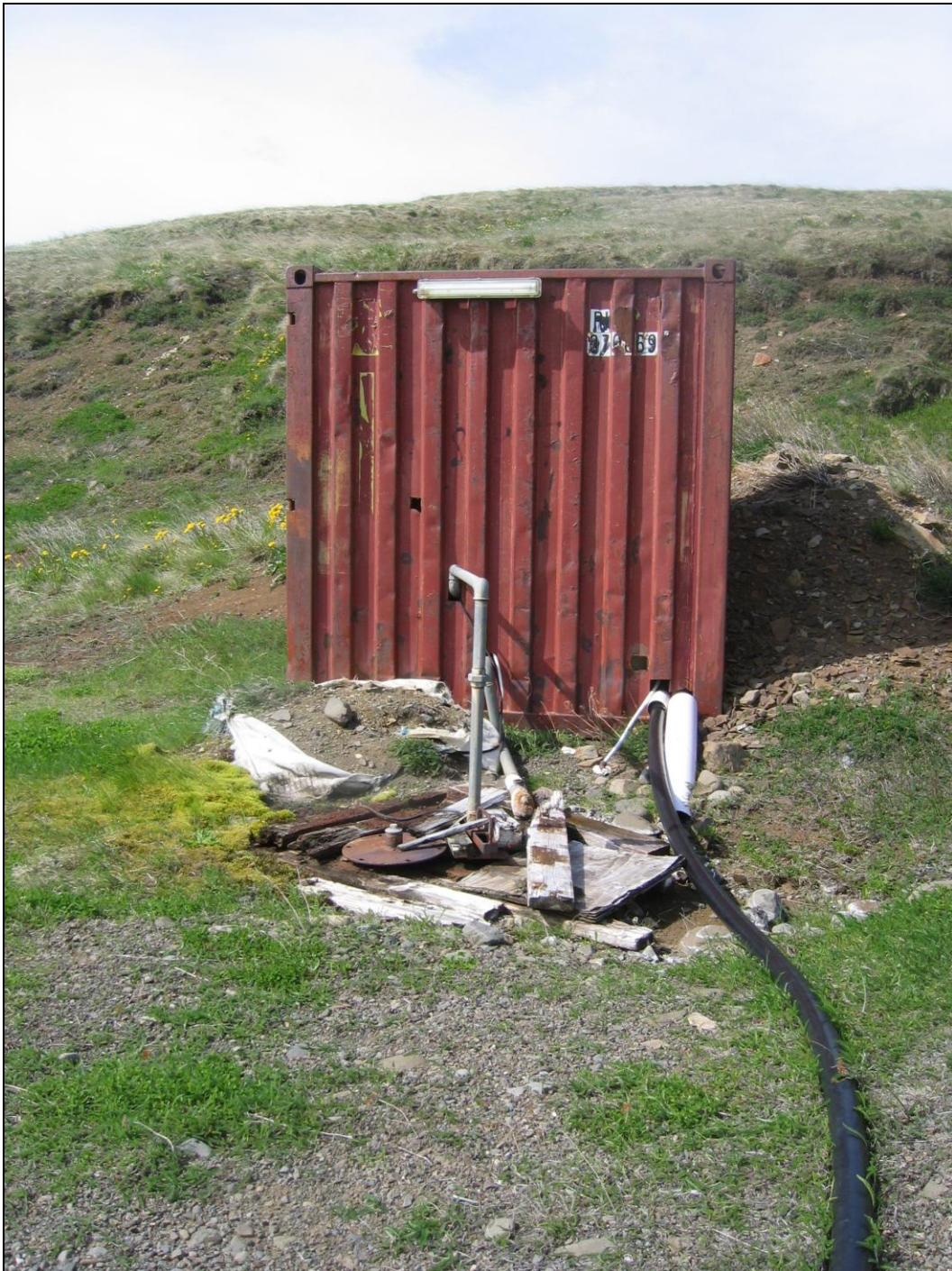
3. mynd. Borhola KL-10 er nær á myndinni og dæluskúrinn fjær.

Borhola KL-10 er 20 metra suðvestur af holu KL-09 og á sama borteig (2., 3. og 4. mynd). Holan er að mestu opin og illa frá henni gengið. Vatnið er leitt inn í lítinn gám og þar er dæla sem dælir vatninu á bæina sem það nýta. Yfirfall er frá holunni niður í lækinn. Heitt vatn frá holunni er leitt á eftirtalda bæi: Tinda, Ingunnarstaði, Klett og Hóla.