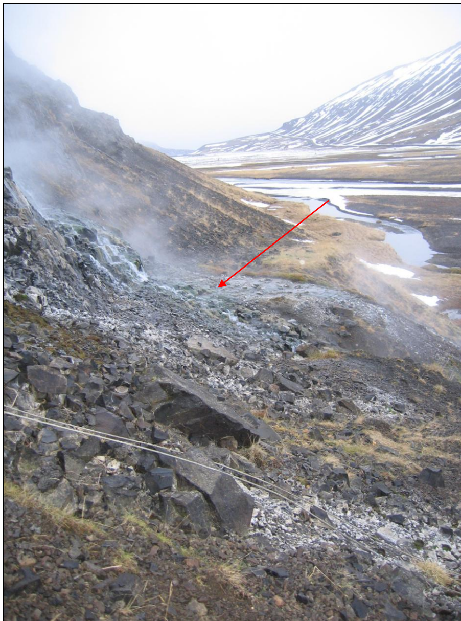
3. mynd. Staðsetning borholu DD-01 í Djúpadal í Gufudalshreppi hinum forna. Holan var þar sem örin vísar.

Hola DD-01 er á litlum palli sem grafinn hefur verið inn neðst í hlíðinni undir Laugarhjalla. Holan sést nú ekki lengur (3. mynd).