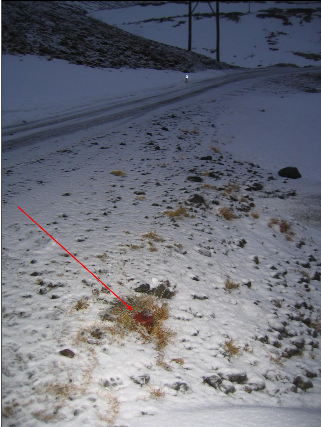
5. mynd. Borhola GD-01 í Neðri-Gufudal.

Borholan er inn við Álftadalsá og því rétt við merkin við Fremri-Gufudal. Hóla er í vegkantinum og er við það að hverfa undir ofaníbúð. Annars er hola í þokkalegu standi.