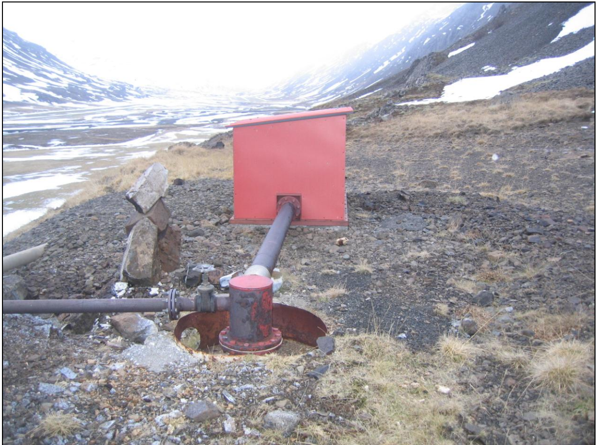
4. mynd. Borhola DD-02 í Djúpadal.

Borhola DD-02 er uppi á Laugarhjalla skammt frá þeim stað þar sem laugin var fyrrum. Umbúnaður er þokkalegur en þó er holutoppurinn nokkuð farinn að ryðga. Afrennsli af holunni fer um rör fram af hjallanum. Holan er nýtt til upphitunar á húsum í Djúpadal og í innisundlaug sem þar er.