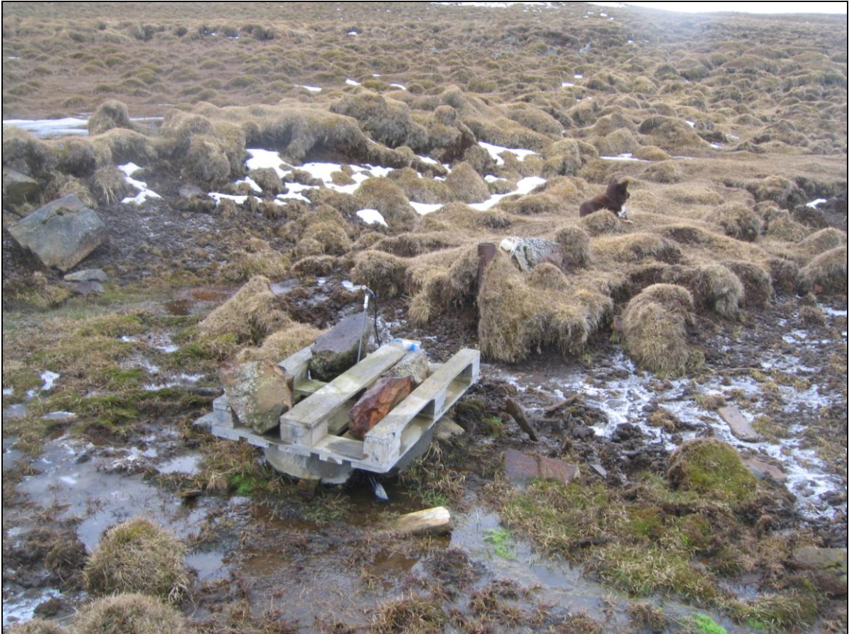
3. mynd. Borhola LD-02 í Laugardal. Steinrör er utan um holuna.