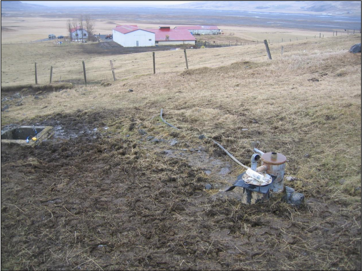
2. mynd. Borhola LD-01A í Laugardal.