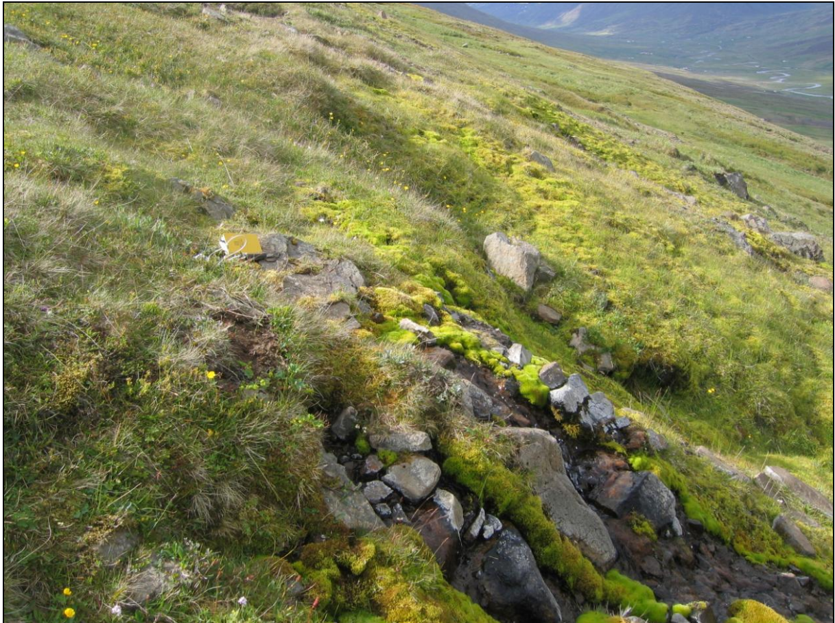
5. mynd. Jarðhitastaður H-04 í Hólkoti. Horft inn dalinn.

Jarðhitastaður H-04 er um 10 metrum innar í hlíðinni. Þar kemur upp volgt vatn á um fjögurra metra kafla og sprettur það út úr samlímðri urð. Hiti mældist 12,0°C og rennsli er metið 1-2 l/s. Hvítar útfellingar eru á steinum og brúnt slý. Vatnið er leitt í bláa tunnu neðar og notað í fiskeldi. (5. mynd)