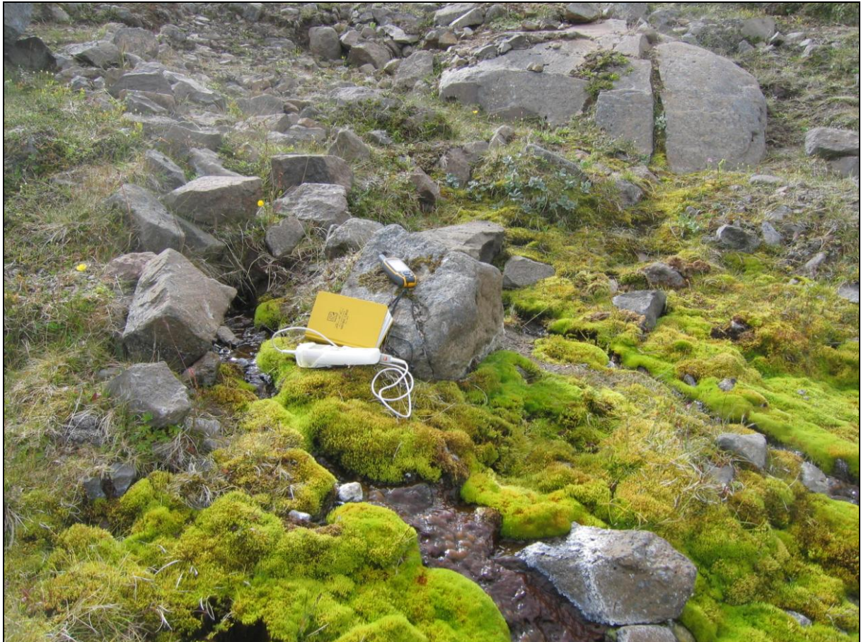
6. mynd. Jarðhitastaður H-05 í Hólkoti. Horft inn dalinn.

Jarðhitastaður H-05 er um 12 metrum innar en síðasti staður. Þar eru tvö augu og um metri á milli. Kemur upp í samlímdri urð. Hiti mældist 12,4°C og rennsli metið 0,5-1 l/s. Hvítar útfellingar eru á steinum og rauðbrúnt slý. (6. mynd)