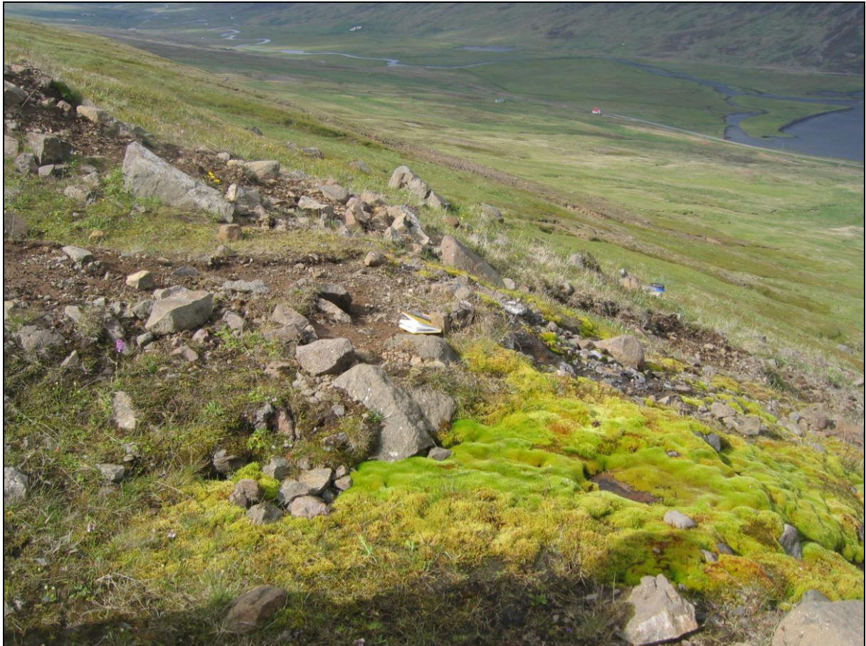
3. mynd. Jarðhitastaður H-02 í Hólkoti. Horft inn dalinn.

Jarðhitastaður H-02 er um tveimur metrum innar en H-01. Vatn kemur upp á um 3-4 metra kafla úr samlímdri urð. Hæsti hiti mældist 9,01°C og rennsli metið 0,1-0,2 l/s, vatns mest yst. Hvítar útfellingar á steinum. (3. mynd)