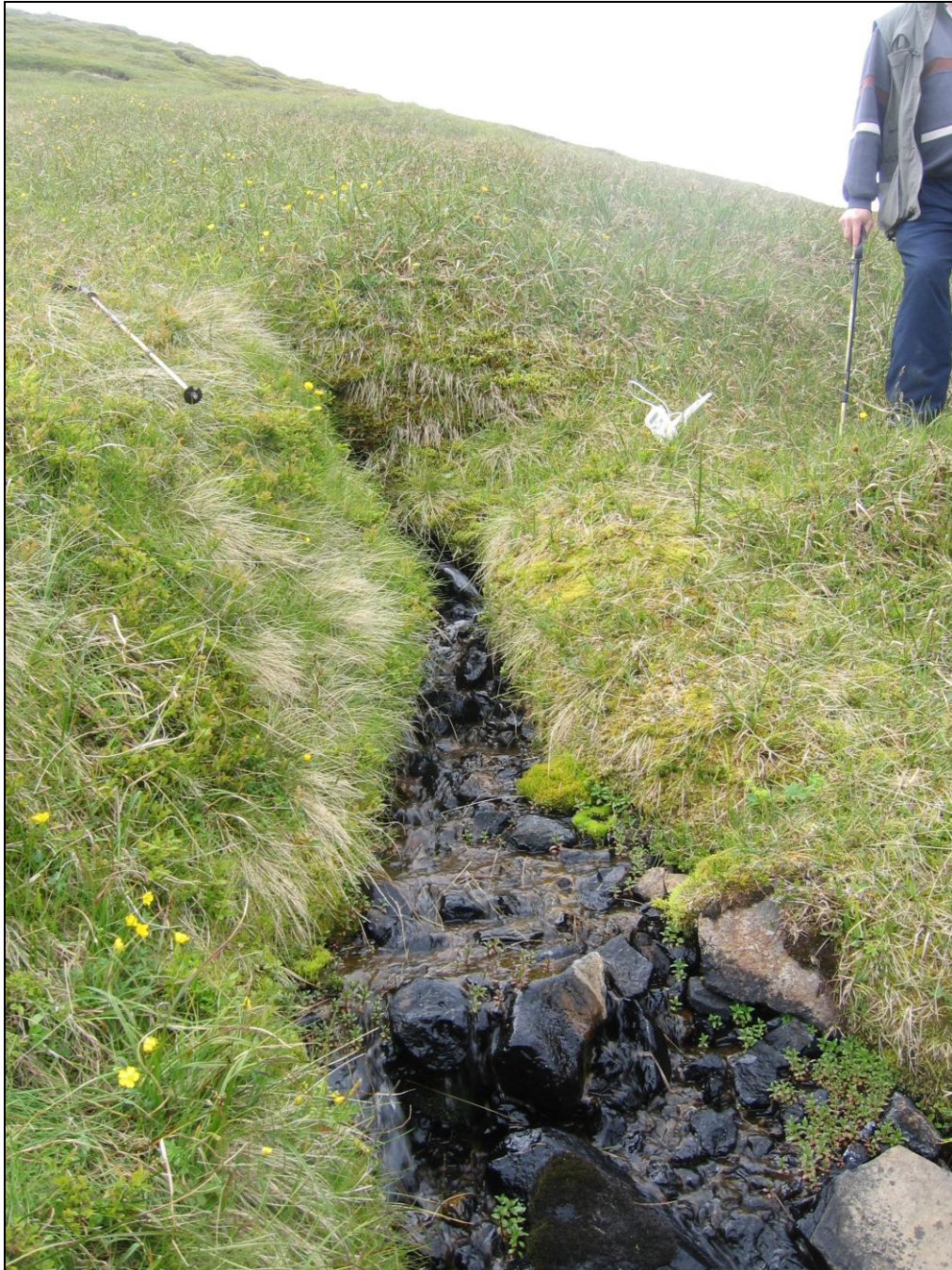
1. mynd. Jarðhitastaður B-01 á Burstabrekku.

Einn jarðhitastaður er í Burstabrekkulandi og er hann norðan undir Hólshyrnu í um 230 m hæð. Hann er skammt utan við landamerkin við Hólkot. Þarna er stór og mikill grasgeiri og einn lækurinn er 7,4°C heitur og er rennsli metið um 1 l/s. Örlar á hvítum útfellingum á steinum. Vatnið er leitt í kar og notað sem neysluvatn. Telja verður víst að fleiri jarðhitastaðir séu í þessum grasgeira. (1. mynd)