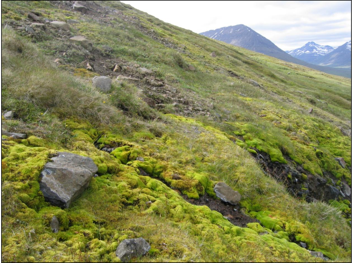
7. mynd. Jarðhitastaður H-06 í Hólkoti. Horft inn dalinn.

Um þremur metrum innar eru velgja í urð og mældist hiti þar 12,0°C og rennsli metið 0,5 l/s. Hvítar útfellingar á steinum og brúnt slý. (7. mynd)