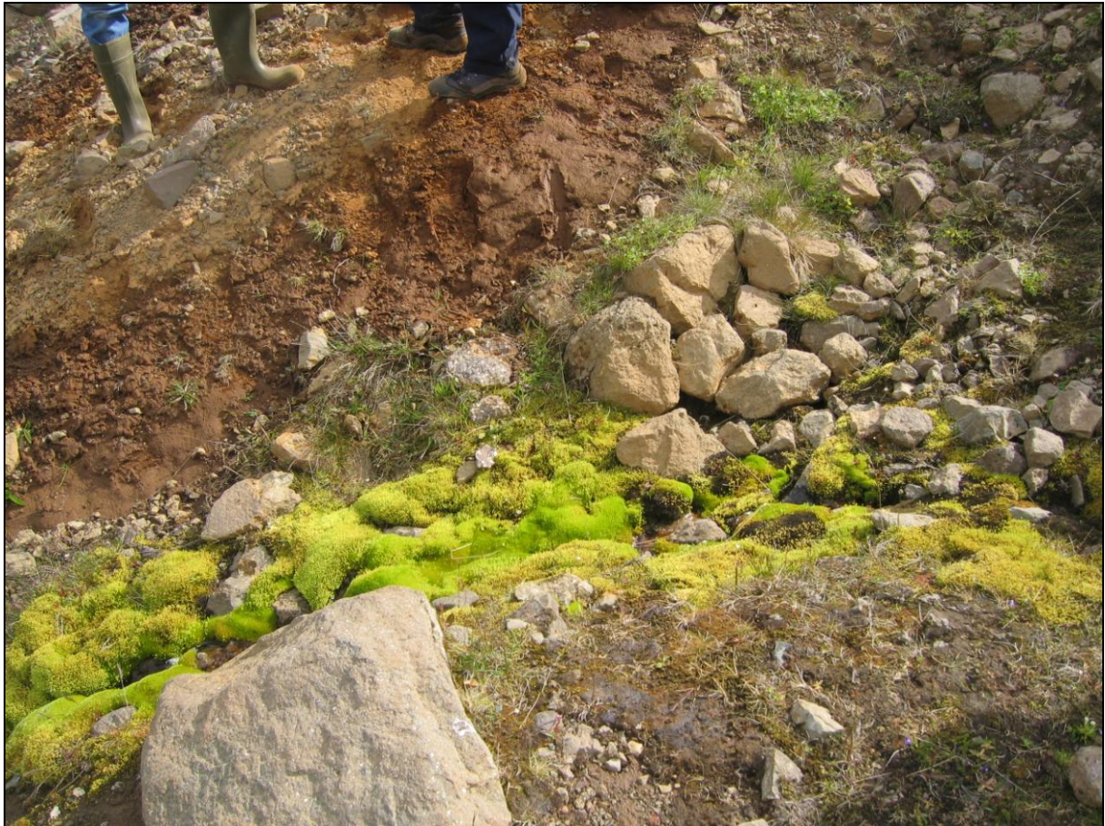
2. mynd. Jarðhitastaður H-01 í Hólkoti.

Jarðhitastaður H-01 er um 230 metrum innar í hlíðinni og eilítið neðar en B-01. Hiti mældist 8,6°C og rennsli metið 0,2-0,3 l/s. Hvítar útfellingar á steinum. (2. mynd)