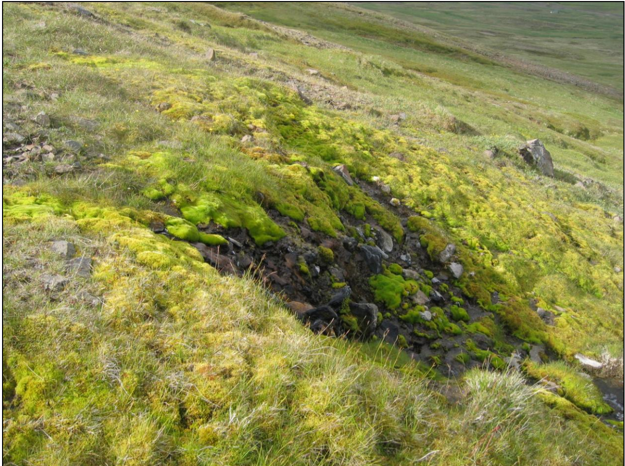
8. mynd. Jarðhitastaður H-07 í Hólkoti. Horft inn dalinn.

Um tveimur metrum sunnar kemur upp volgt vatn á um 4-5 metra kafla og kemur út úr samlímdri urð. Hiti mældist hæstur 12,3°C og rennsli er um 1-2 l/s. Hvítar útfellingar eru á steinum og brúnt slý. (8. mynd)