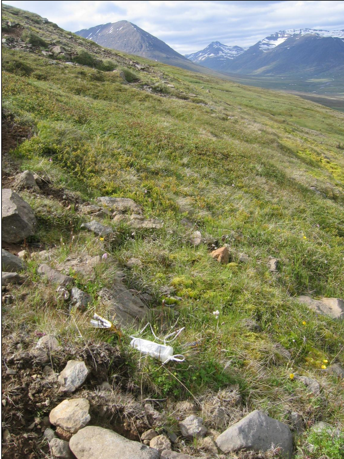
4. mynd. Jarðhitastaður H-03 í Hólkoti. Horft inn dalinn.

Um sex metrum innar en staður H-02 er ómerkileg velgja. Kemur upp í urð og mældist hiti 11,4°C en rennsli er hverfandi. Hvítar útfellingar á steinum og gulleitt slý. (4. mynd)