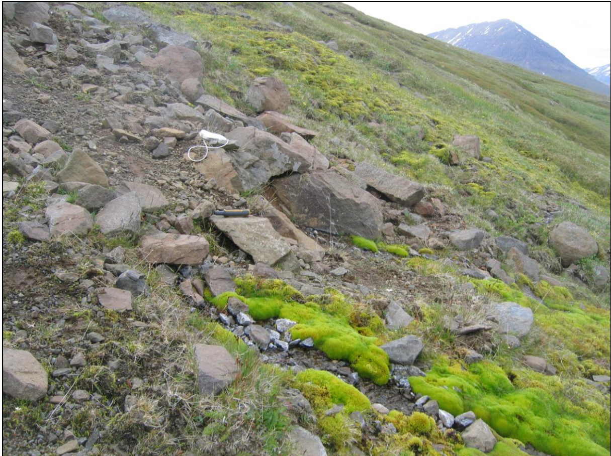
9. mynd. Jarðhitastaður H-08 í Hólkoti. Horft inn dalinn.

Jarðhitastaður H-08 er um 10 metrum innar en H-07 og nokkru ofar. Þar koma upp tvö augu í urð og er um einn metri á milli þeirra. Hiti mældist 11,4°C og rennsli metið 0,1-0,2 l/s. Hvítar útfellingar eru á steinum. (9. mynd)